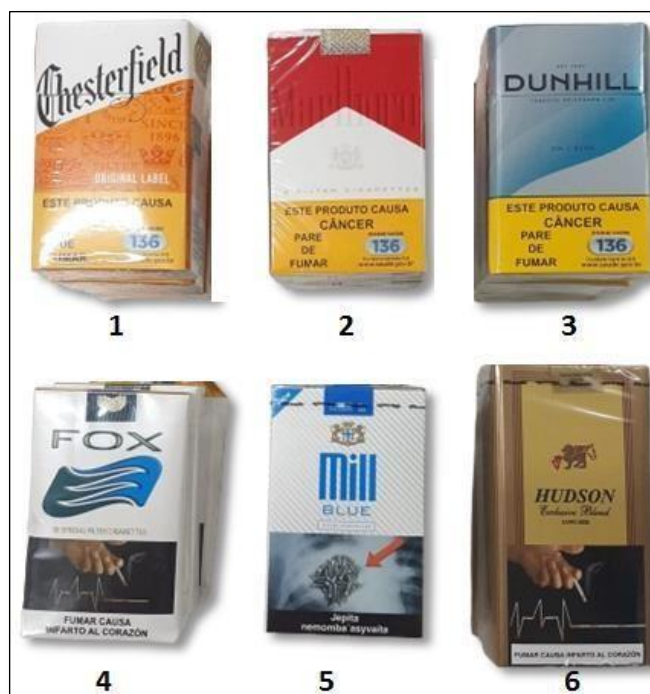
Figura 1. Marcas de cigarros selecionados neste estudo: 1 - Chesterfield (origem Brasil); 2 - Marlboro (origem Brasil); 3 - Dunhill (origem Brasil); 4 - Fox (origem Paraguai); 5 - Mill Blue (origem Paraguai); 6 - Hudson (origem Paraguai).