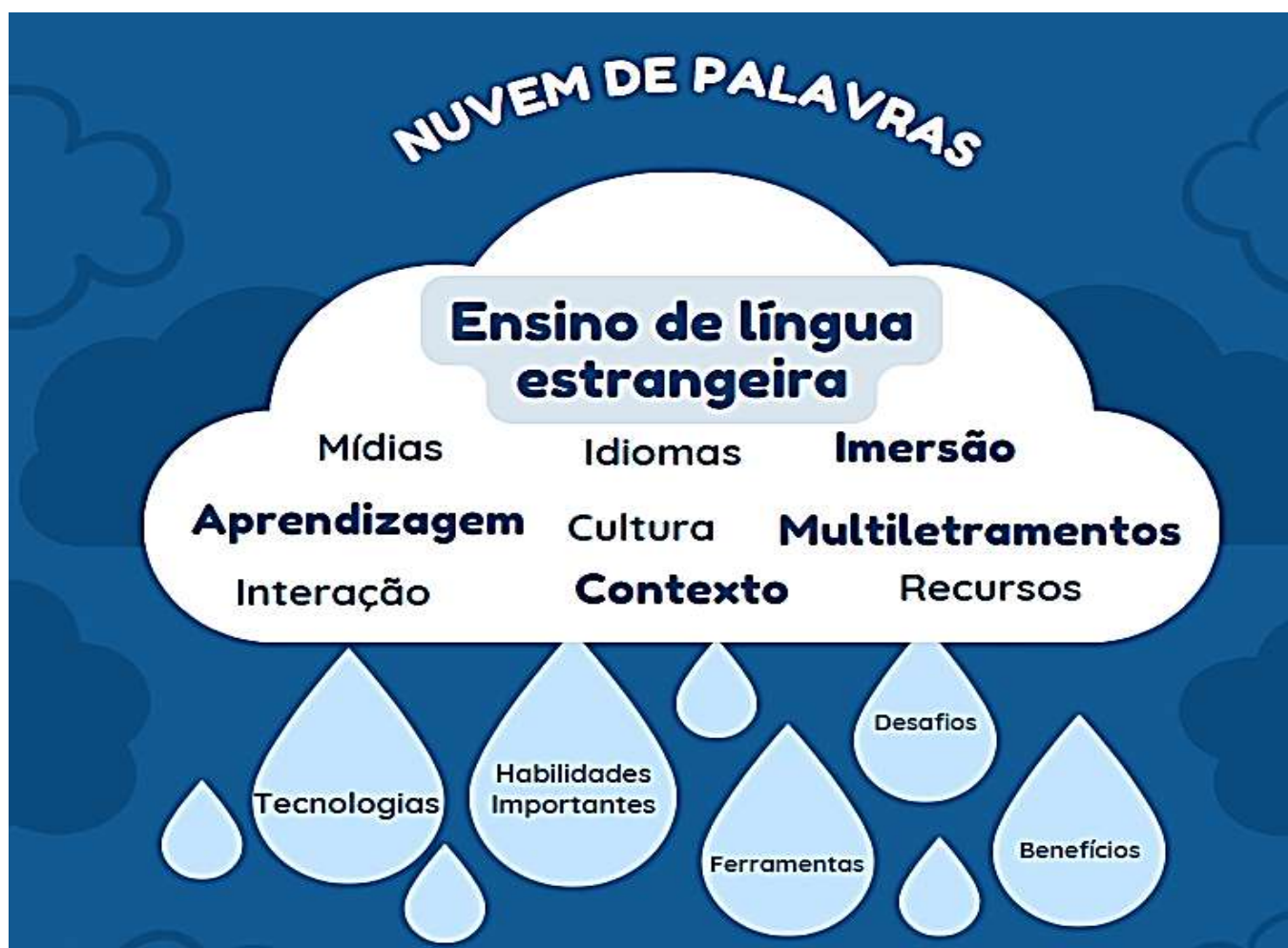
Figura 3: Nuvem de palavras

Na sequência consta um brainstorm de palavras frequentes que apareceram nas respostas da segunda parte questionário.