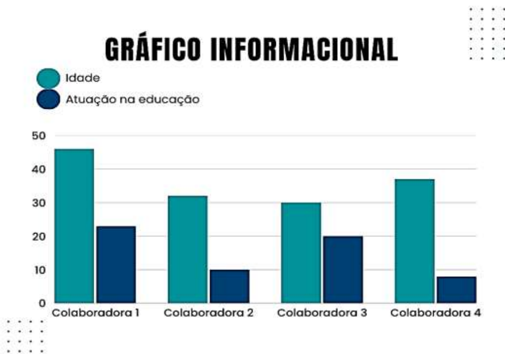
Gráfico 1: Questionário Parte A- Tempo de Atuação Profissional