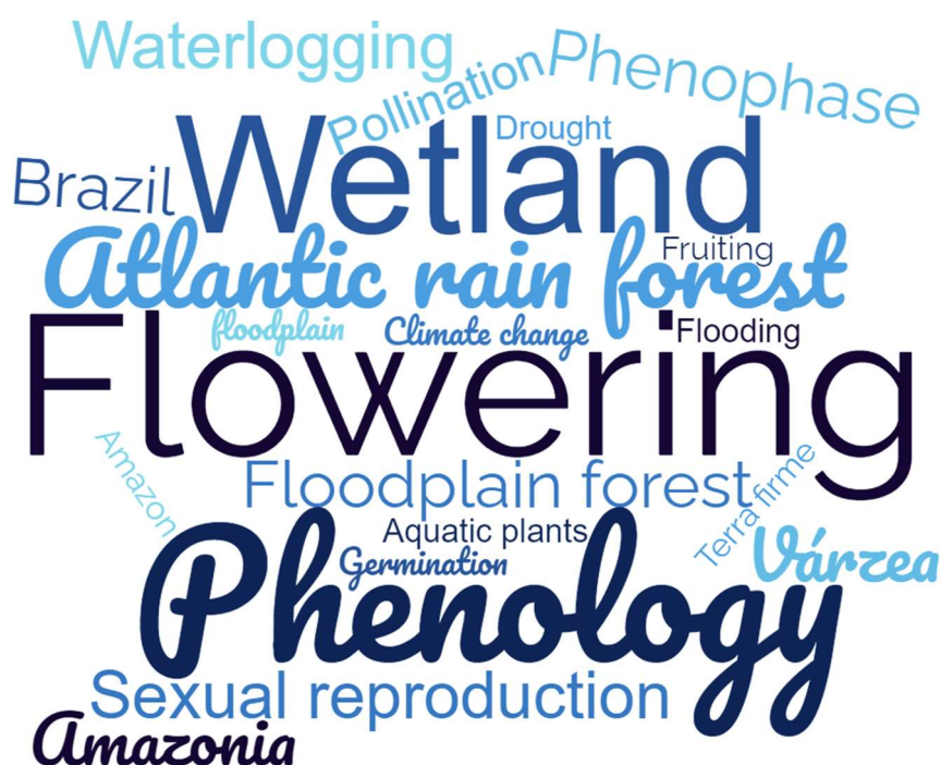
Figura 3. Nuvem de palavras utilizando as palavras-chaves disponíveis nos artigos publicados sobre fenologia em áreas inundáveis segundo a base de dados Scopus, até 2021.

Foram incluídas 544 espécies nas amostragens fenológicas, distribuídas em 368 gêneros e 107 famílias (Arquivo Suplementar 1). Alguns estudos apresentaram a identificação apenas em nível de família, para evitar superestimativas de riqueza, não consideramos essas informações nesta fase de análise. Asteraceae e Fabaceae tiveram o maior número de espécies investigadas (66), seguida de Poaceae (41), Polygonaceae (28), Cyperaceae (18) e Onagraceae (17). Asteraceae é cosmopolita e constitui uma das maiores famílias de Angiospermas (Roque et al. 2017), assim, é compreensível que figure entre as mais estudadas. Esta família inclui ervas anuais, bianuais ou perenes, arbustos, subarbustos, menos frequentemente árvores ou lianas, geralmente terrestres, raro epífitas ou aquáticas (Flora e Funga do Brasil 2023). Da mesma forma, Fabaceae está entre as três maiores famílias de plantas, com 795 gêneros e quase 20.000 espécies (Lewis et al. 2005, LPWG 2017), apresentando grande diversidade de formas de vida e na morfologia de suas estruturas e, por isso, está entre as mais diversas em praticamente todos os grandes biomas globais (Flora e Funga do Brasil, 2023).