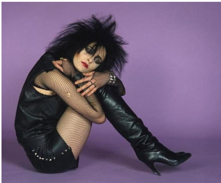
Figura 1 - Siouxsie Sioux, vocalista da banda Siouxsie and The Banshees , apesar de transitar entre os variados subestilos góticos, na foto abaixo, representa o estilo clássico ou trad goth , que em tradução livre significa gótico tradicional.