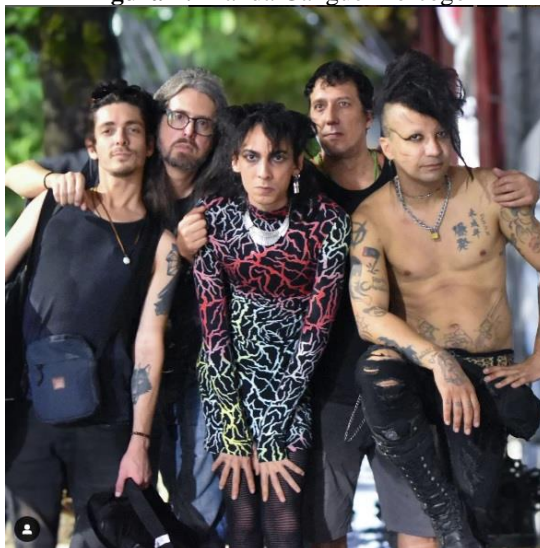
Figura 4: Banda Gangue Morcego