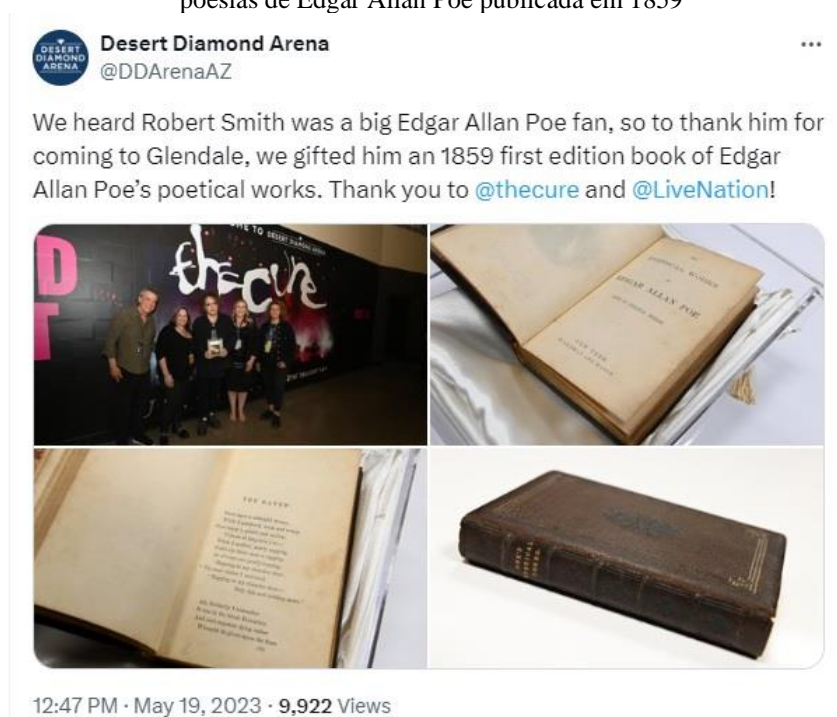
Figura 21 – Robert Smith no Desert Diamond Arena , ao receber um exemplar das poesias de Edgar Allan Poe publicada em 1859