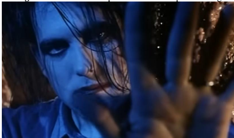
Figura 20: Robert Smith performando no clipe Lovesong