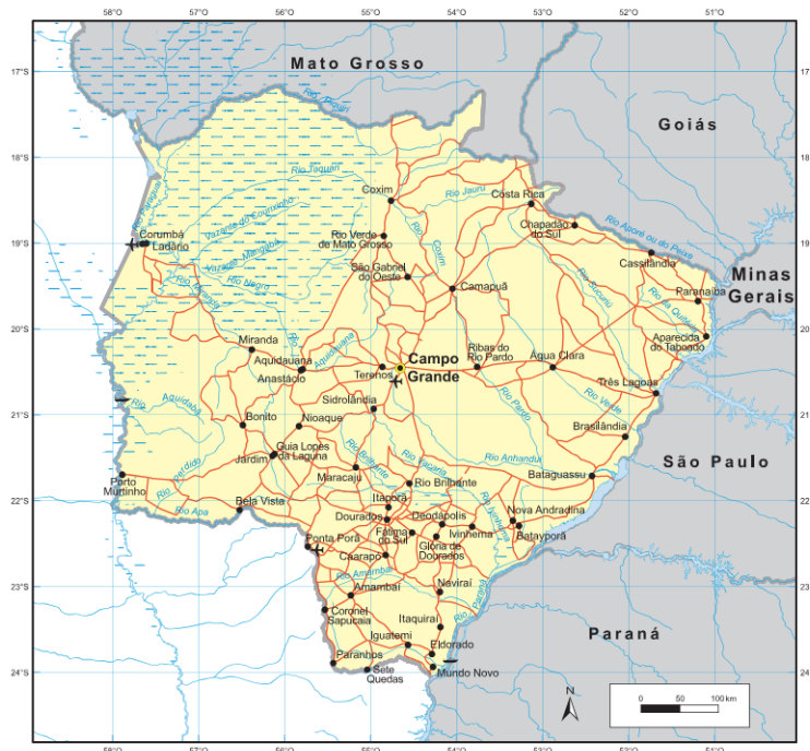
Figura 4 - Mapa de Mato Grosso do Sul - IBGE

Reforçando a ideia do espaço fronteiriço, as variadas possibilidades encontradas para a entrada e escoamento de ilícitos, em Mato Grosso do Sul, como ilustrado na Figura 4, é encontrada uma região de fronteira de 650 km, que, desse total, 300 km são de fronteira seca, resultando em uma das mais vulneráveis áreas de fronteira do país (JÚNIOR, Moacir Henrique et al. , 2024, p. 61).