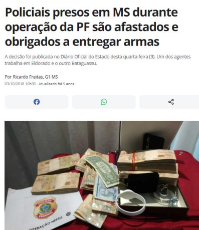
Figura 5 - Notícia do portal G1 sobre a deflagração da operação Nepsis 36

A estrutura dessa OrCrim vai de encontro às principais características trazidas anteriormente. A composição dela, conforme amplamente divulgada, contava com a participação de policiais rodoviários federais, policiais militares e de policiais civis do Estado de Mato Grosso do Sul.