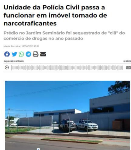
Figura 10 - Imóvel sequestrado de organização criminosa 57