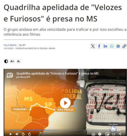
Figura 9 - matéria do jornal Record TV

A característica que pertence a cada organização criminosa pode ser identificada por meio do já mencionado modus operandi (forma de agir ou meio empregado). Neste caso, investigações policiais levaram à deflagração de duas outras operações que identificaram uma organização que praticava, além do contrabando de cigarros paraguaios, a traficância de entorpecentes. O grupo criminoso identificado se autodenominava “velozes e furiosos”, 52 conforme Figura 9, em alusão à saga cinematográfica conhecida por ser uma trama de ação, muita velocidade, assaltos e vinganças.