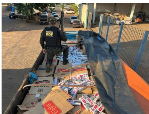
Figura 6 - Apreensão de cigarros contrabandeados pelo DOF

Uma segunda equipe do DOF compareceu ao local e auxiliou nas buscas pelas imediações, porém, o homem não foi localizado. Equipes do DOF permanecem na região em busca do furtivo. A ocorrência foi registrada e entregue na Receita Federal em Ponta Porã. O prejuízo estimado ao crime foi de R$ 953 mil.