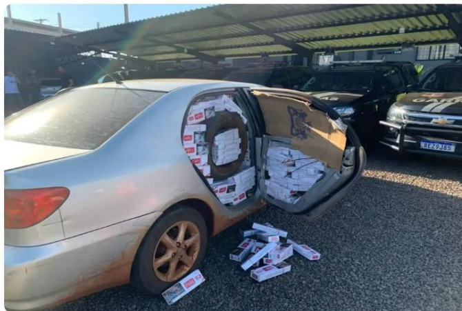
Carro preparado com produtos contrabandeados.