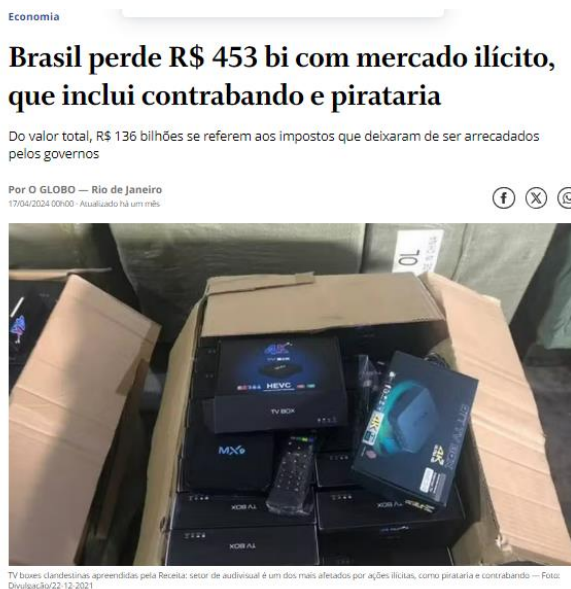
Figura 1 - Notícia veiculada pelo jornal O Globo

Confederação Nacional da Indústria (CNI), Federação das Indústrias do Estado do Rio de Janeiro (FIRJAN) e pela Federação das Indústrias de São Paulo (FIESP), no intitulado “Brasil Ilegal em Números”, publicada pelo jornal O Globo, demonstrada na Figura 1: