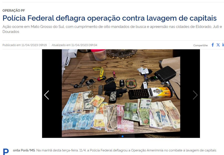
Figura 8 - Operação Amerímnia

A organização, mesmo com condenações pelas práticas dos crimes antecedentes de contrabando (de cigarros), corrupção e organização criminosa, não suspenderam as atividades empresariais e mantiveram a lavagem de dinheiro mediante empresas de transporte, postos de gasolina e conveniências, além da utilização de familiares e terceiros como ‘laranjas’ (ENFOQUE MS, 2023). 50