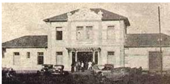
Figura 1 - Edifício da estação ferroviária de Campo Grande (1935)

O filme desde o início seria de época, para trazer a estética de época para filmes feitos em Campo Grande e contar, em conjunto com a história, como era viver em Campo Grande em certo período. Para a ambientação foi utilizado o recorte da Campo Grande dos anos 30. Nesse período a linha férrea tinha grande força sobre o estado e estava em um acelerado crescimento.