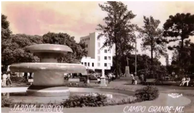
Figura 5 - Atual Praça Ary Coelho