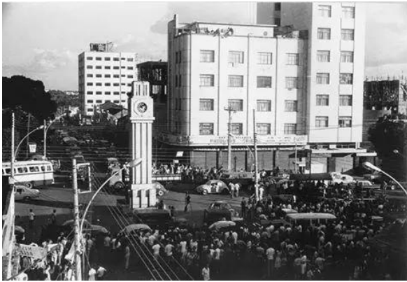
Figura 3 - Torre do Relógio, 1933