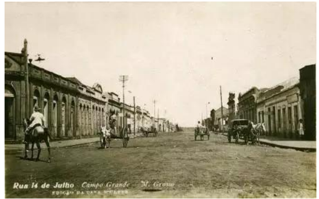
Figura 4 - Rua 14 de Julho