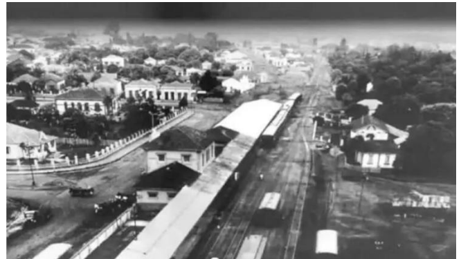
Figura 6 - Antiga Ferroviária