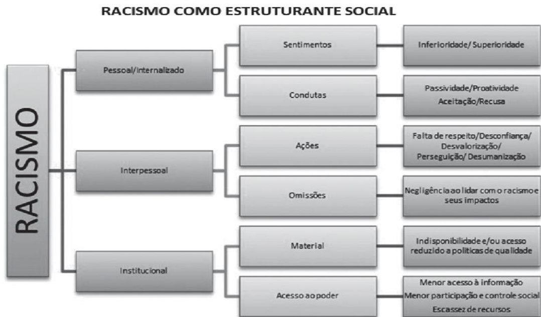
Figura 2 - Dimensões do Racismo

Fonte: baseado no modelo proposto por Jones (2002).