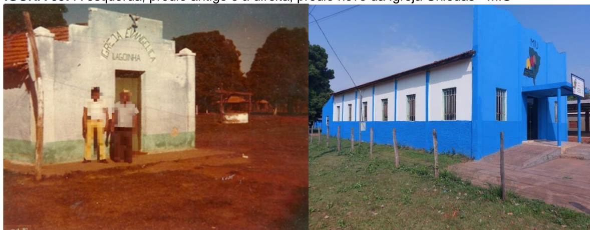
FIGURA 09: À esquerda, prédio antigo e à direita, prédio novo da Igreja Uniedas - MIU

Fonte: Arquivo pessoal da autora. Aldeia Lagoinha, (esquerda sem data) (Direita, 2024)