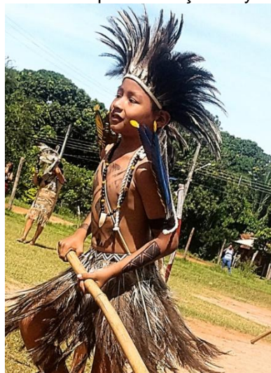
FIGURA 20: Criança Terena se divertindo enquanto dança a Híyokena Kipae.

Fonte: Arquivo pessoal da autora. Aldeia Lagoinha, 2023.