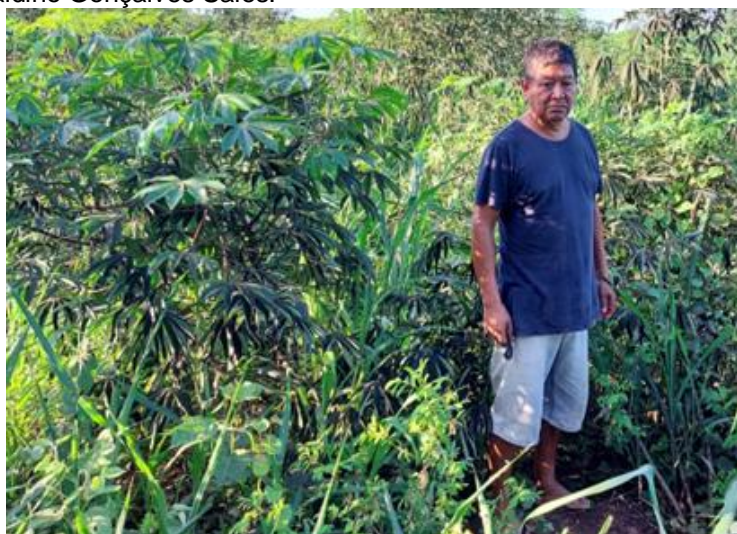
Aldeia Lagoinha, 2024.