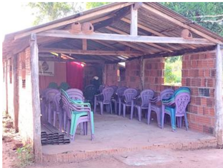
Aldeia Lagoinha, 2024.

Atualmente, cerca de 30 membros, distribuídos em 10 famílias, frequentam a igreja. O local dos cultos é construído no quintal do pastor e está em fase de construção. Os dias de culto são quarta-feira (oração), quinta-feira (louvor) e domingo (família). A liderança da igreja sempre foi e continua sendo composta por membros da comunidade terena, não oferecendo atividades para a comunidade em geral.