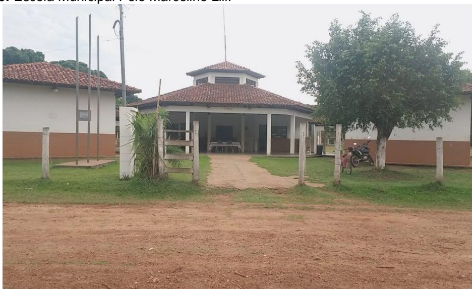
FIGURA 06: Escola Municipal Polo Marcolino Lili.

Aldeia Lagoinha, 2023.