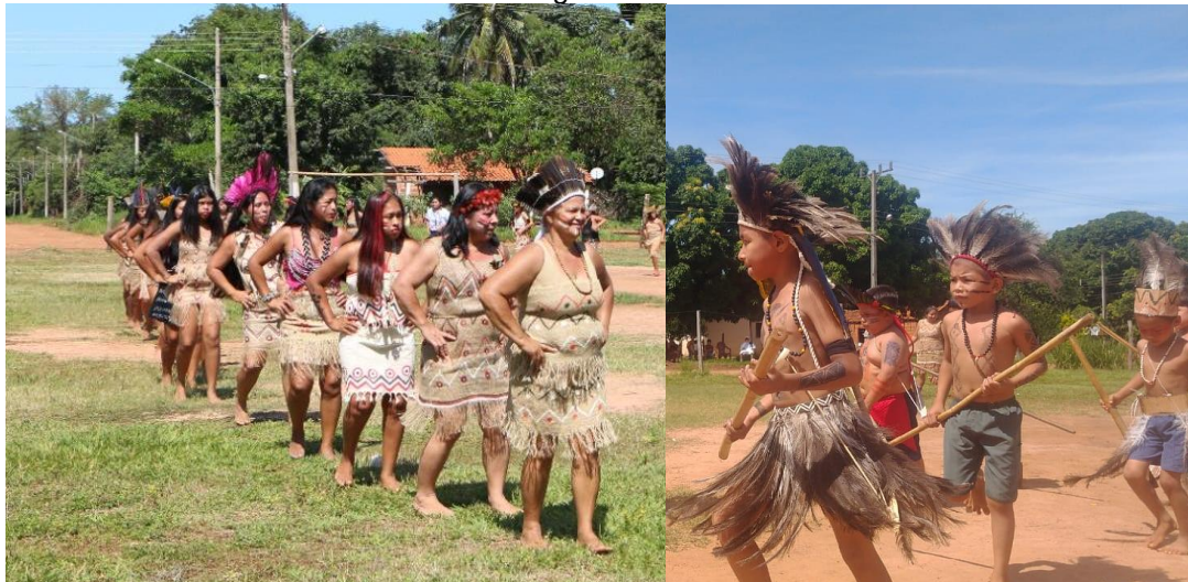
FIGURA 02: À esquerda a dança das mulheres Terena e à direita crianças dançam a dança da Ema durante festividade do dia do índio na aldeia Lagoinha em 2023.