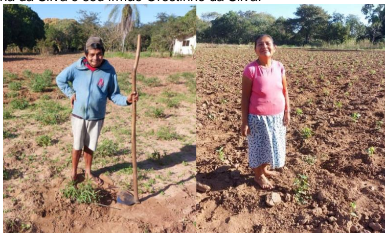
Aldeia Lagoinha, 2024.