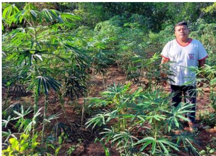
Aldeia Lagoinha, 2024.