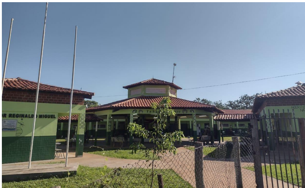
Aldeia Lagoinha, 2023