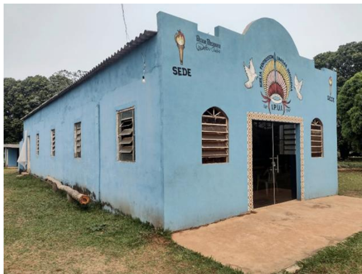
Aldeia Lagoinha, 2024.

Os cultos ocorrem às quartas-feiras (culto de oração), sextas-feiras (unção com óleo) e domingos (culto da família). Toda a liderança é composta por membros da comunidade Terena, sendo a igreja desprovida de atividades direcionadas especificamente para a comunidade.