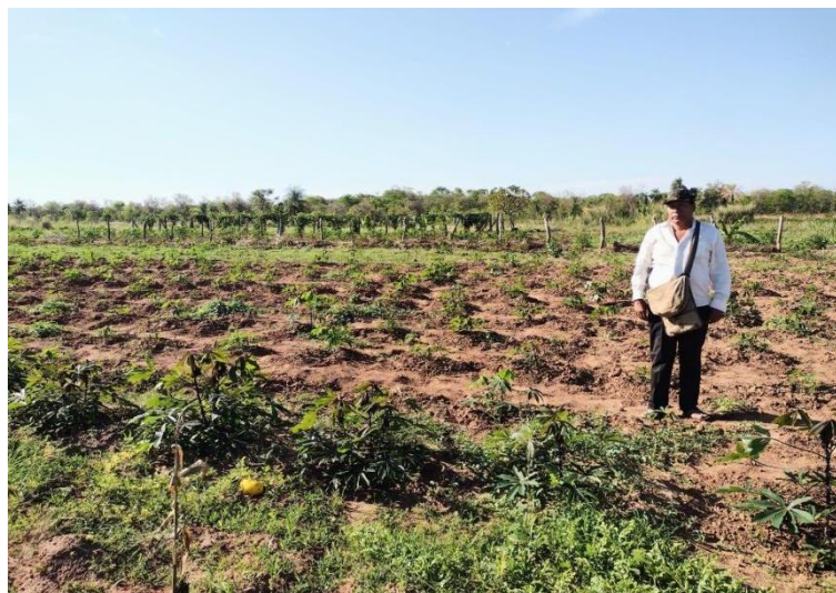
Lagoinha, 2024.