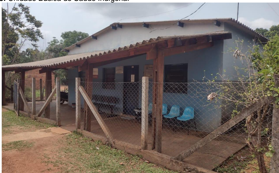
Figura 08: Unidade Básica de Saúde Indígena.

Aldeia Lagoinha, 2022.