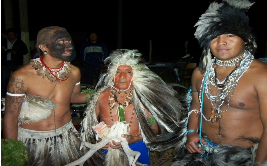
Aldeia Lagoinha, 2014.