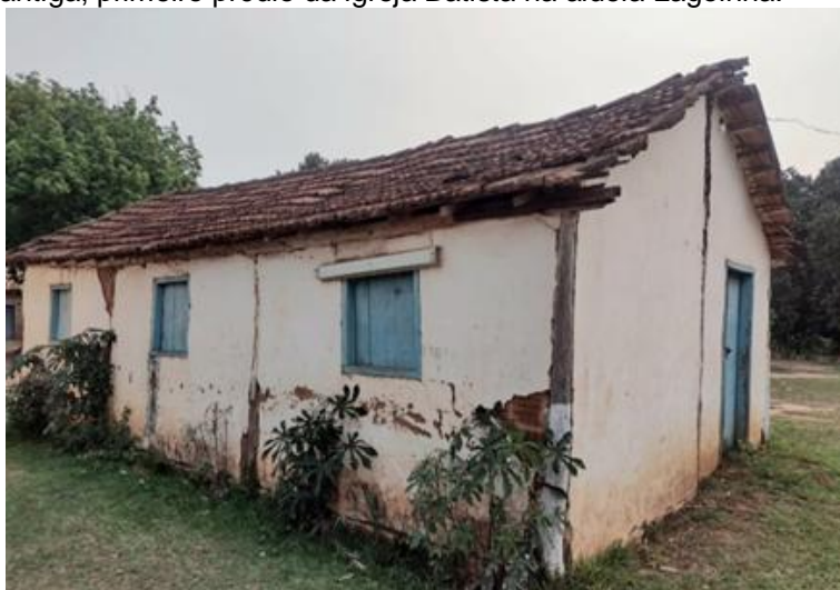
Aldeia Lagoinha, 2023.