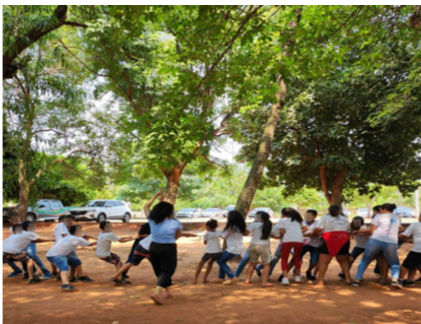
Figura 1- Resgatando brincadeiras de quintal – Turma do 5º ano do Ensino Fundamental.