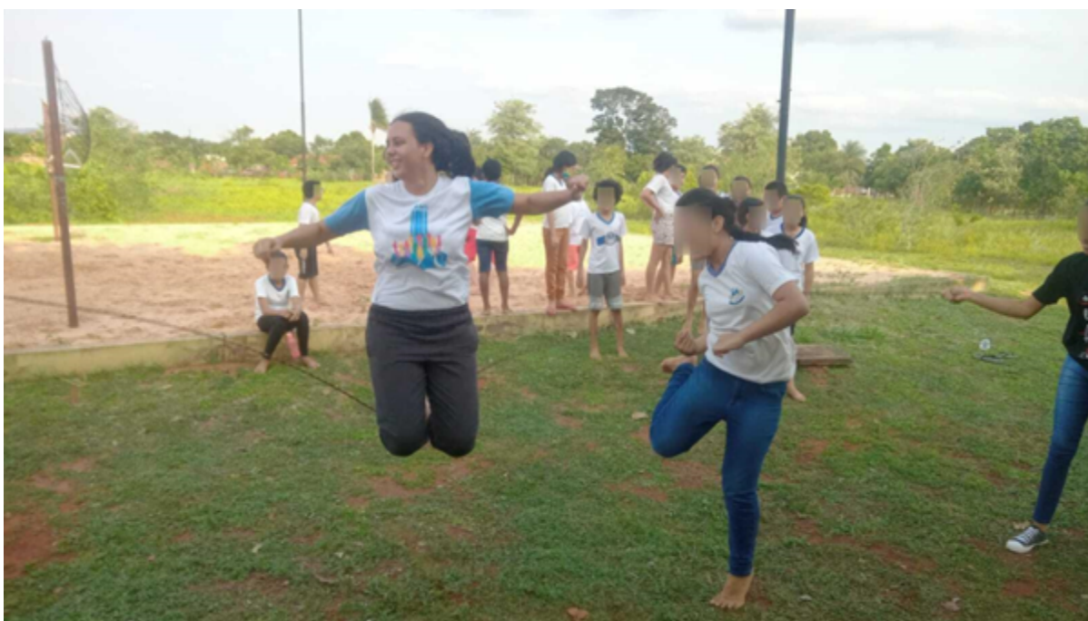
Figura 3 - Resgatando Brincadeiras de quintal – Turma do 5º ano Vespertino, Escola Erso Gomes.

As memórias de infância funcionam como as raízes de uma árvore, sustentando e nutrindo nosso desenvolvimento ao longo da vida. Elas moldam nossa personalidade, influenciam nossas emoções e comportamentos, e são fundamentais na constituição da nossa identidade. Experiências positivas podem proporcionar confiança e resiliência, enquanto experiências negativas podem criar desafios emocionais que nos acompanham na vida adulta.