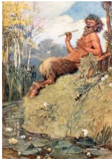
Figura 6 O Deus e a cana, Norman Price. Fonte: meisterdrucke.pt

Jerônimo associa determinados seres mitológicos, como o sátiro — ser da natureza, de corporeidade híbrida entre humano e bode — e a figura do deus Pã, a representações do mal. Tradutor da Bíblia para o latim (Vulgata), o santo também comenta, no livro de Isaías, que a Babilônia seria habitada por “corpos cobertos de pêlos”, os chamados “servos do Diabo”, evocando assim imagens que remetem a características de seres mitológicos, especialmente de Pã, cuja forma com pés fendidos e chifres foi reinterpretada como símbolo demoníaco. O que antes representava a fertilidade e o vínculo sagrado com a natureza passa, então, a significar a bestialidade, como signo da ausência de bem — um processo simbólico que também marca a dessacralização da natureza.