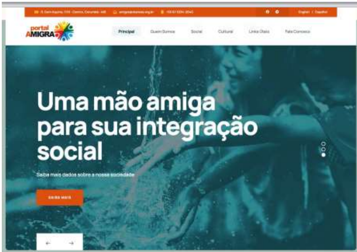
Figura 4 - Layout da página da AMIGRA