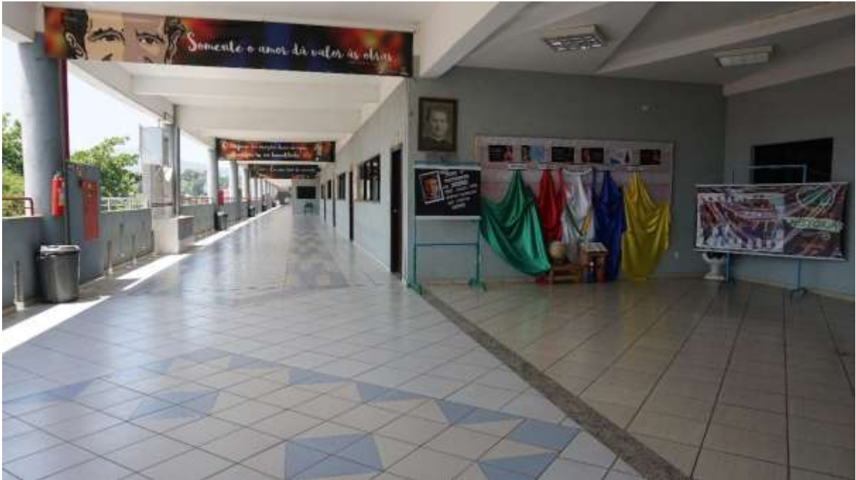
Figura 2 - Foto do bloco onde são realizadas aulas da Faculdade Salesiana de Santa Teresa