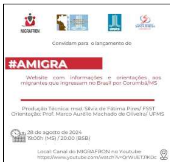
Figura 7 - Convite para o lançamento do website AMIGRA

Desta feita, o website AMIGRA foi desenvolvido pautando-se em assuntos correlatos a migração, e serviços públicos e privados para o atendimento dos migrantes, com informação nos idiomas português, inglês e espanhol. Implantou-se também, uma ferramenta que possibilita ao usuário selecionar outros idiomas, além do português temos inglês e espanhol, que facilitam o seu acesso. O AMIGRA foi apresentado e disponibilizado na rede mundial de computadores, no dia 28 de agosto de 2024, no canal do MIGRAFRON, conforme convite amplamente divulgado (Figura 7).