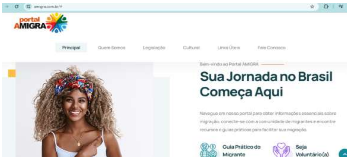
Figura 5 - Abas presentes no website AMIGRA

O AMIGRA conta com as abas: Principal , Quem Somos , Legislação , Cultural , Links Úteis , e Fale Conosco (Figura 5):