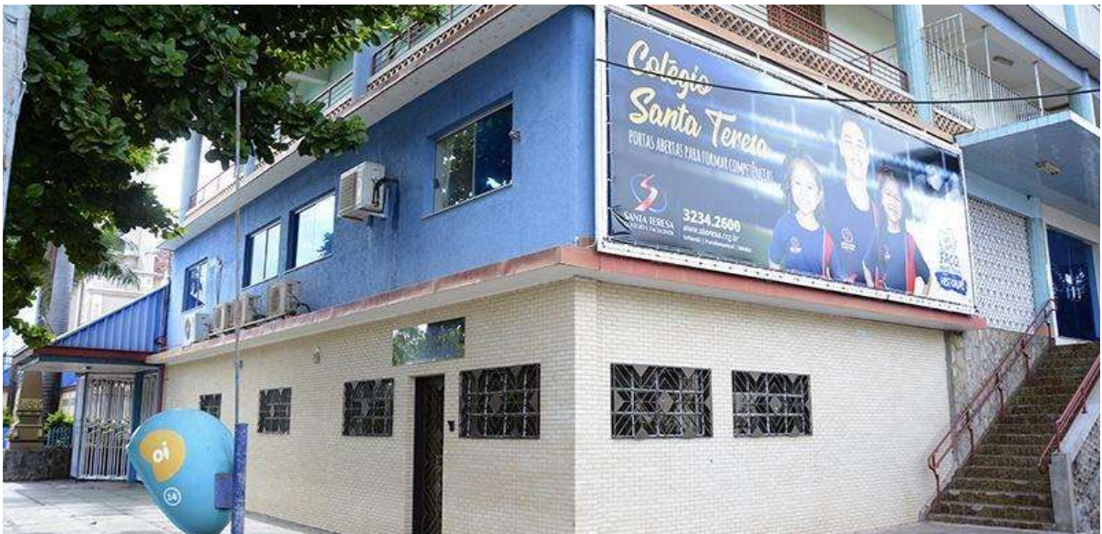
Figura 1 - Foto externa do Núcleo de Práticas Jurídicas Zilda Arns do curso de Direito da Faculdade Salesiana de Santa Teresa