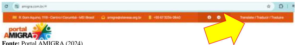
Figura 6 - Sessão do site da AMIGRA contendo o tradutor

As informações cadastradas no AMIGRA podem ser traduzidas em tempo real para qualquer idioma de interesse do usuário, basta clicar no ícone Translate / Traducir / Traduire (Figura 6).