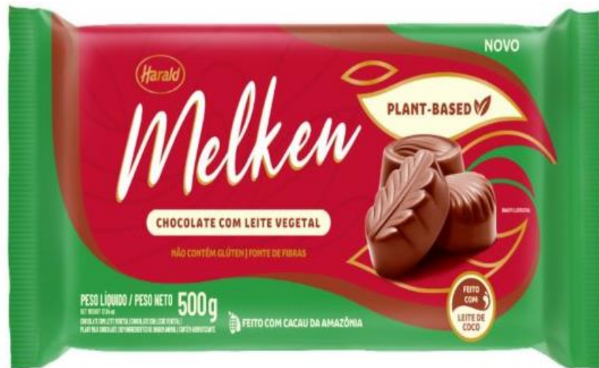
Figura 4 – Chocolate plant-based da marca Harald