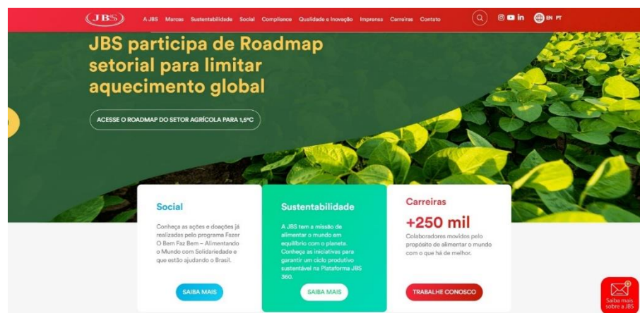
Figura 1 – Página principal do site da JBS