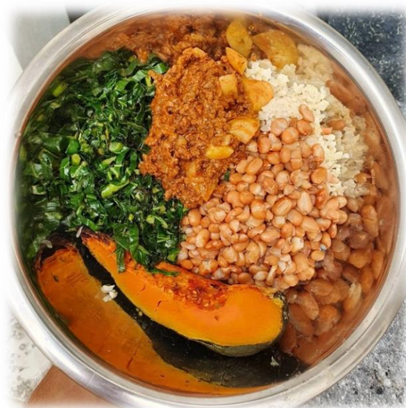
Figura 6 – Prato do Vegano Periférico

Fonte: Vegano Periférico. Disponível em: https://www.veganoperiferico.com.br/post/entre-eventos-mercados-e-mercadinhos-a-informa%C3%A7%C3%A3o-se-torna-mais-importante-do-que-o-consumo . Acesso em: 5 mai. 2023