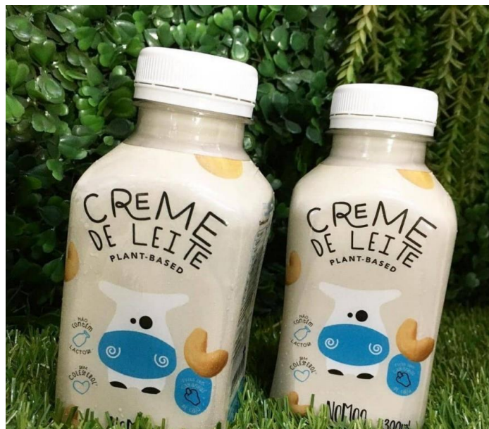
Figura 3 – Creme de leite plant-based da marca NoMoo