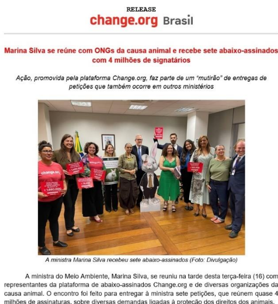
Figura 7 – Change.org e causa animal

Fonte: change.org. Destinatário: Vegazeta. Paraná, 22 mai. 2023. 1 mensagem eletrônica