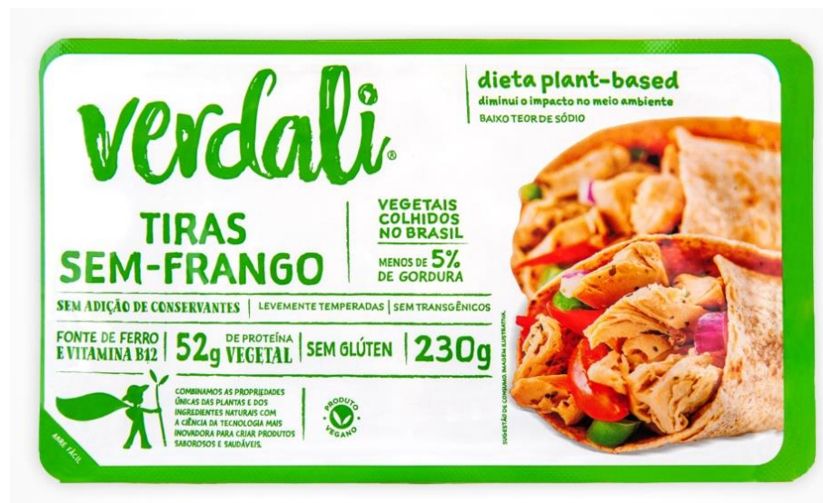
Figura 5 – Carne de frango vegetal da marca Verdali