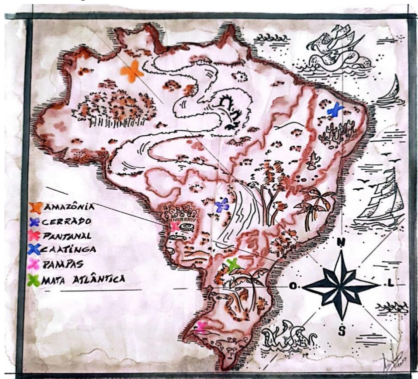
Fonte: Autoria de Larissa Rodrigues. Fotografia de Ana Carolina Torelli M. Faccin (2023).