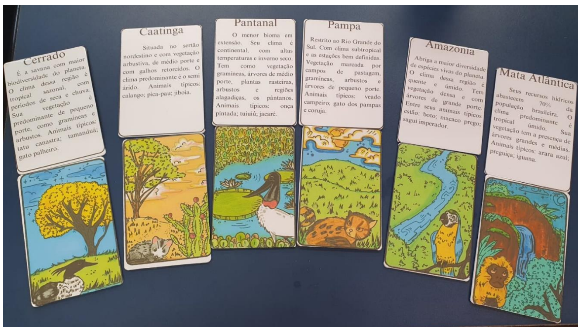
Figura 4. As cartas do Jogo dos Biomas (2023)