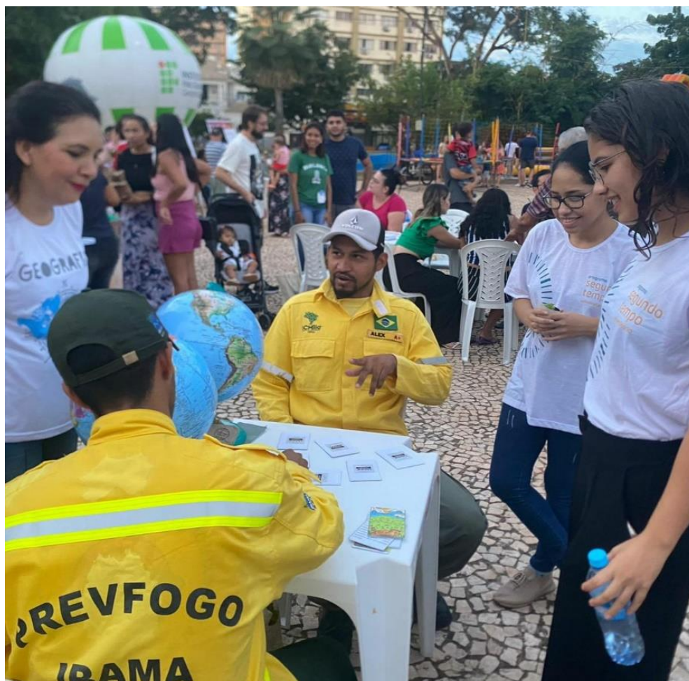
Figura 14. Representantes do IBAMA participando do jogo.

Algumas pessoas que estavam se apresentando em outros stands também pediram para participar e jogar no seu tempo livre (figura 14 e 15). Foram bastante competitivos, desafiaram amigos e colegas de trabalho, se divertiram, ganhando ou perdendo.