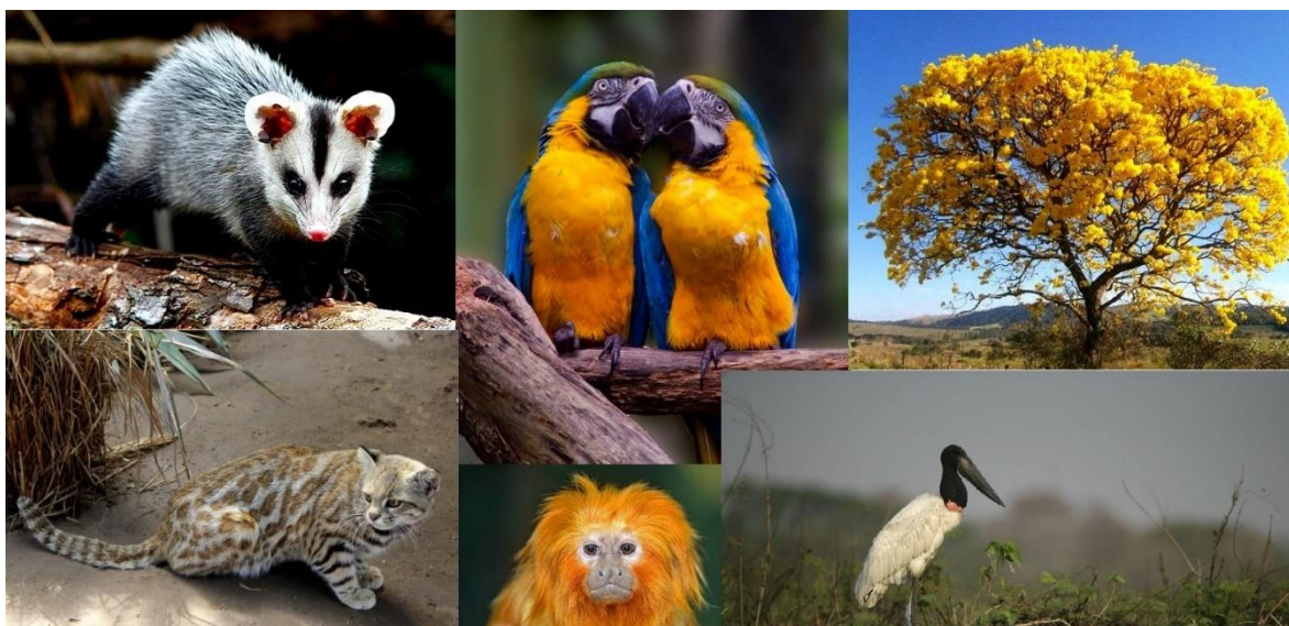
Figura 3. Imagens de referência utilizadas como base para ilustrações do Jogo dos Biomas.