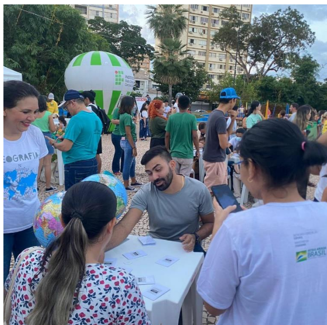
Figura 11. Jovens, adultos e idosos participando da aplicação do Jogo dos Biomas.

O Jogo dos Biomas foi apresentado e aplicado no dia 04 de Junho de 2023 na Feira do Meio Ambiente (2023), que aconteceu na Praça da Independência na cidade de Corumbá-MS. O jogo foi uma das atrações do stand do curso de Geografia do Campus do Pantanal 2 . O público atraído foi diverso, pois apesar de ser um jogo criado para crianças aprenderem mais sobre os biomas, muitos adultos de idades variadas, entre jovens e idosos, também puderam participar e jogar (figura 11 a 15).