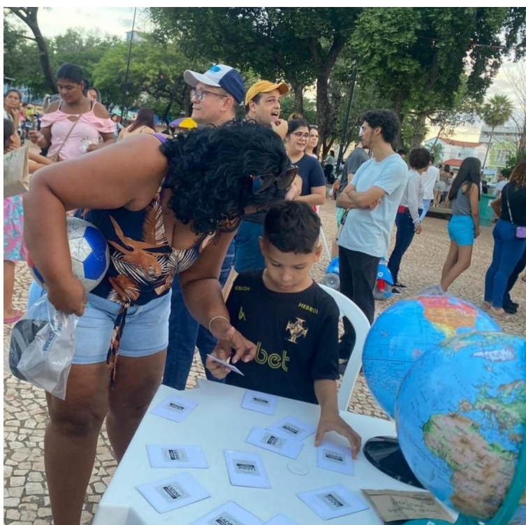
Figura 16. Crianças participando da aplicação do jogo.

A aplicação do material foi bem fácil pois as crianças entenderam rapidamente o objetivo do jogo e o que deveriam fazer, algumas levaram mais tempo que outras, mas todas conseguiram assimilar o conteúdo. A seguir temos as imagens das crianças participando do jogo na Praça da Independência (figura 17).