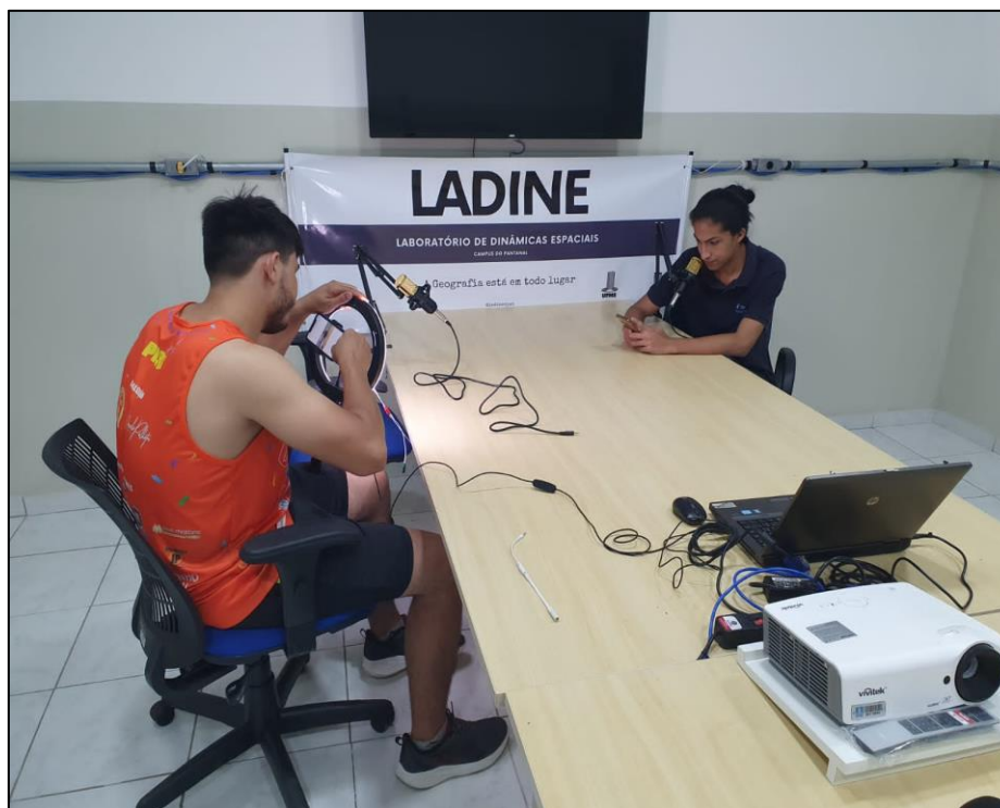
Figura 8. Instalação de equipamentos e testes de som e vídeo para gravações (2023).