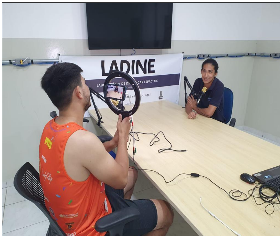
Figura 14. Teste de equipamento e decoração de sala-estúdio (2023).

Vários testes foram feitos para ter certeza de que nenhum incidente infeliz acontecesse novamente (figura 13 e figura 14).