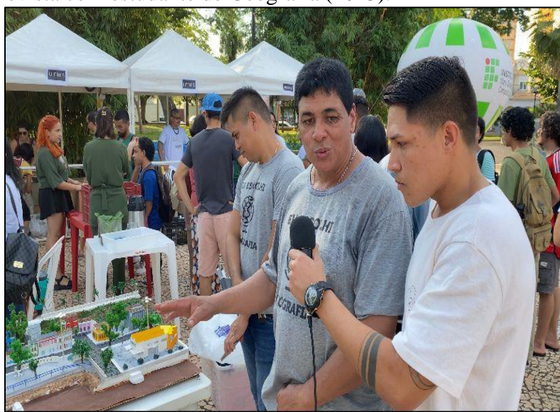
Figura 26. Entrevista com estudante de Geografia (2023).

Seguimos entrevistando os estudantes do curso de Geografia que estavam ali apresentando seus trabalhos (figura 26, 27 e 28)).