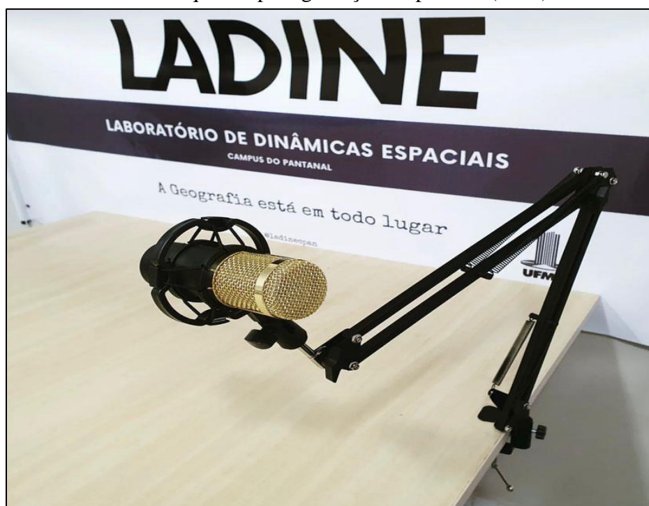
Figura 4. Kit de Microfone adquirido para gravação do podcast (2023).

Diante dessas dificuldades iniciais, resolvemos repensar o modo e em como faríamos as gravações e a aquisição de materiais de melhor qualidade foi necessário. Para a gravação do primeiro episódio foi necessário efetuar a compra de kit microfone de estúdio capaz de suprir a necessidade de melhor qualidade de áudio para as gravações (figura 4).