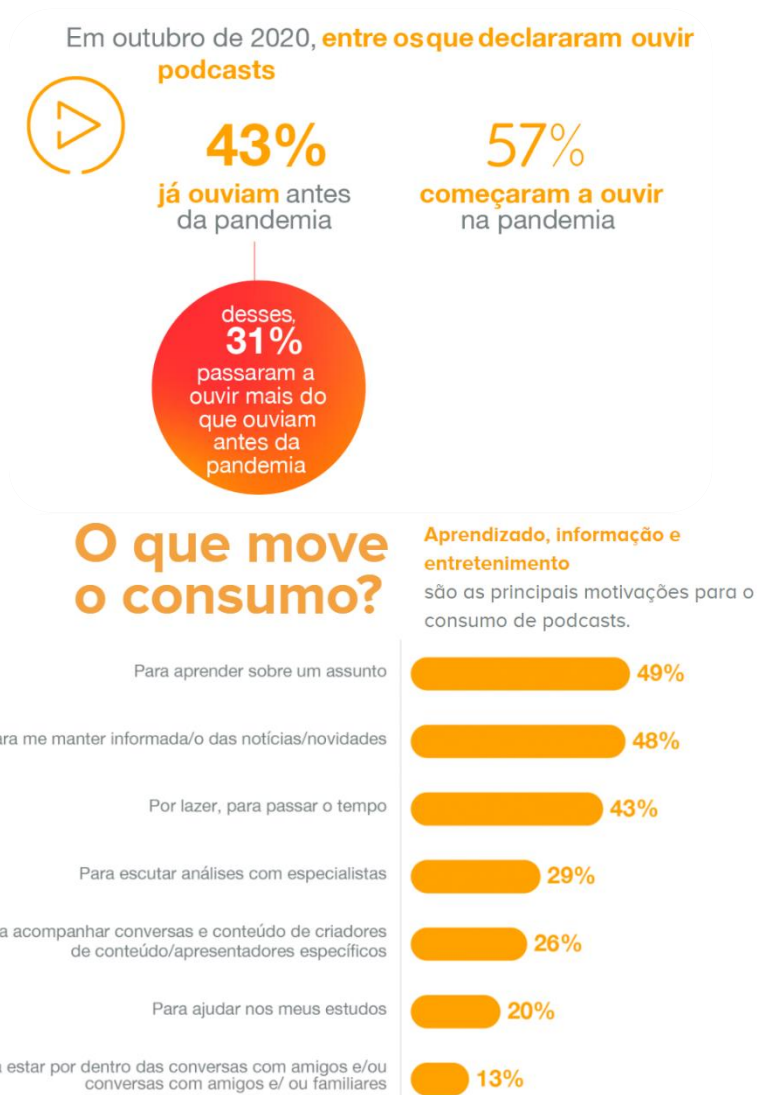
Figura 9. Motivos e porcentagem de ouvintes de podcast no Brasil (2020).

Todo dia temos um método de ensino diferente a ser usado, e o podcast no ensino da Geografia caiu como uma luva, já que podemos conversar sobre determinado assunto sem ficar maçante, enjoativo, produzindo algo divertido e didático. O aumento do uso dos podcasts se deve também à pandemia iniciada em março de 2020, onde houve um crescimento dos recursos remotos, principalmente do uso do podcast , em virtude da necessidade de isolamento social (NASCIMENTO, 2021). Os dados de pesquisa realizada pela Globo Podcast sugerem a confirmação dessa premissa (figura 9).