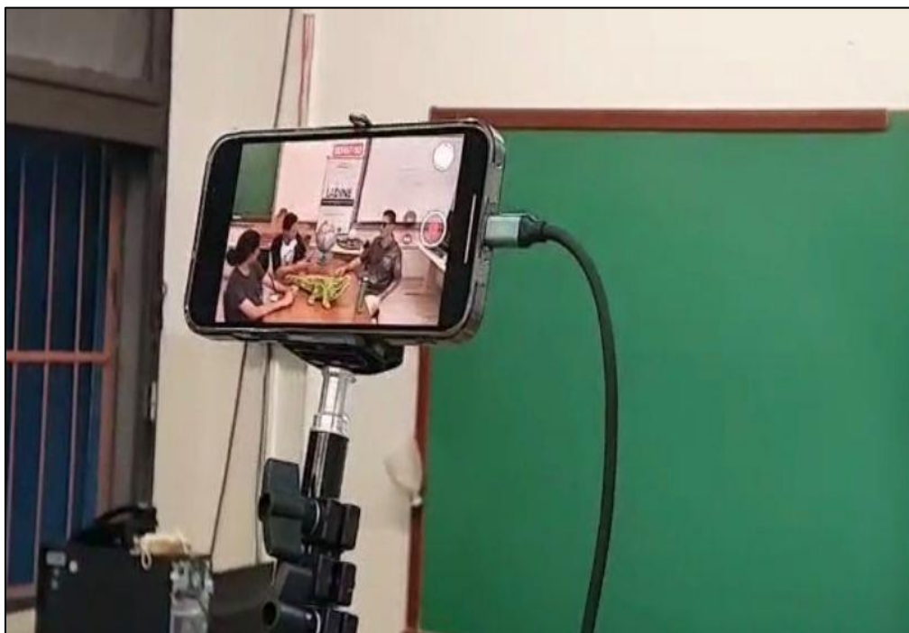
Figura 11. Smartphone como ferramenta de gravação (2023).