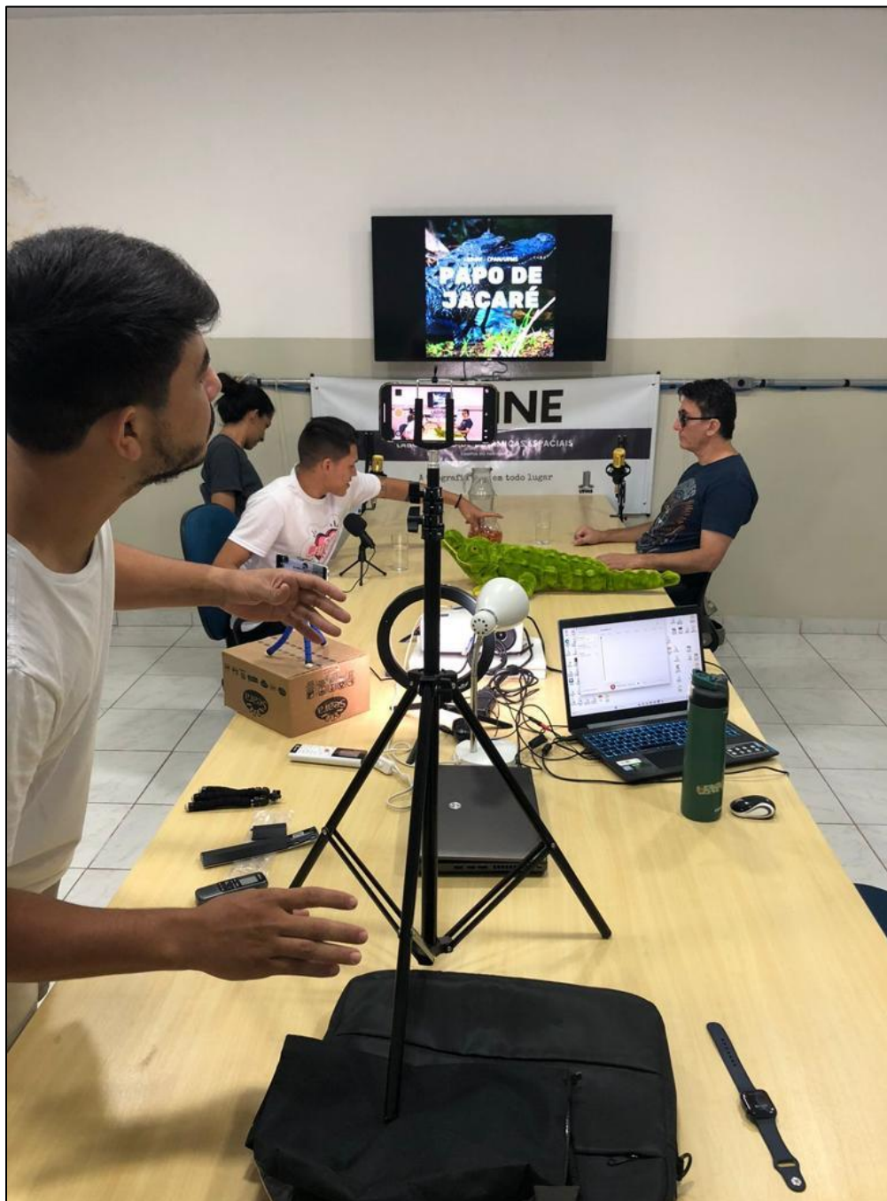
Figura 19. Gravação do vídeo (2023)

Após a montagem do estúdio iniciamos a gravação no horário previsto (figuras 19, 20, 21 e 22). Utilizamos novamente o smartphone do professor para gravar o vídeo da entrevista (figura 19).