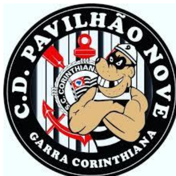
Figura 1: Logo da torcida organizada Pavilhão 9.