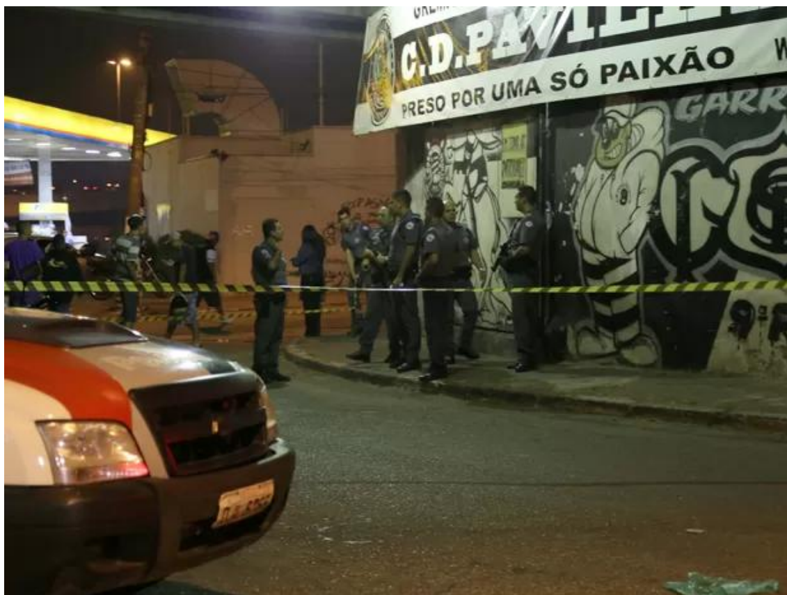
Figura 2: Foto da frente da sede da torcida na Vila dos Remédios na noite da chacina