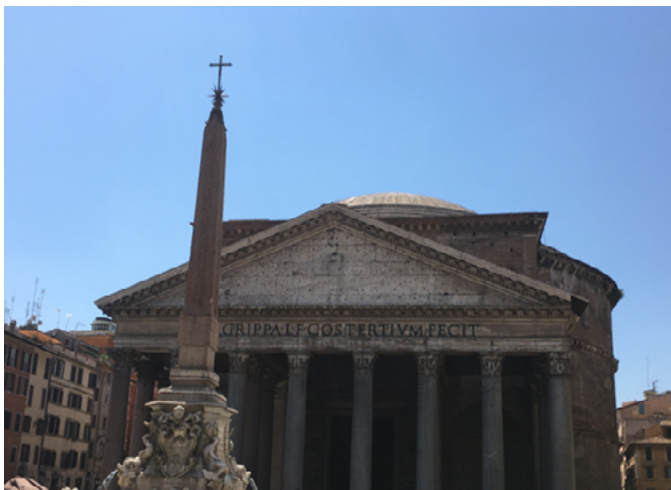
Figura 2. O Panteão na atualidade