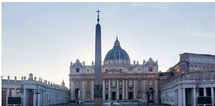
Figura 5. Vista da Basílica a partir da Praça São Pedro, no Vaticano. Detalhe a magnitude da cúpula externa

É essencial destacar a existência de dupla cúpula, sendo uma interna – 41,7 metros de diâmetro – e uma externa – 58,9 metros de diâmetro. A existência de duas cúpulas garante maior estabilidade estrutural, uma vez que a cúpula interna suporta o peso da cúpula externa, distribuindo a carga de forma mais eficiente e reduzindo a pressão sobre as paredes da Basílica. A cúpula externa preserva a cúpula interna de intempéries e variações climáticas, mantendo a temperatura estável no interior da Basílica e protegendo a cúpula interna da umidade. Ainda, dupla cúpula cria um design estético que possibilita produzir um efeito visual tanto do exterior quanto do interior: a cúpula externa, visível de longe, proporciona uma grandiosa visão da Basílica, enquanto a cúpula interna oferece uma experiência suntuosa aos visitantes no interior.