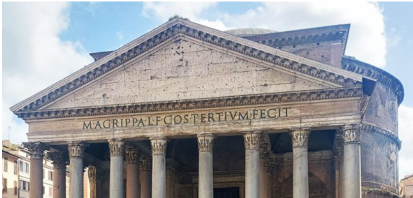
Figura 1. Inscrição no Panteão que faz menção à Agripa

M.AGRIPPA L. F. COS. TERTIUM FECIT 3 . Essa inscrição menciona Marco Agripa, general, edil, amigo e genro do imperador Otávio Augusto. Agripa foi uma figura crucial durante o reinado de Augusto, responsável por diversas obras públicas e pela modernização de Roma. Agripa supervisionou inúmeros projetos na região do Campo Marzio, uma vez que eram essenciais para o desenvolvimento urbano e para o bem-estar da população. Sem interferir na área destinada aos exercícios militares – o Campus Agrippae, foram construídos esgotos, piscinas e uma grande quantidade de edifícios, incluindo a Basílica de Netuno, um extenso complexo de spas e, finalmente o Panteão, que se tornou um dos marcos arquitetônicos mais emblemáticos de Roma.