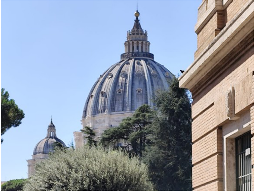
Figura 5. Detalhe aos anéis de compressão na cúpula externa da Basílica, vista do Museu do Vaticano

truída com tijolos encaixados em formas de arcos e nervuras, de modo a substituir o suporte temporário de madeira utilizado na construção. Por fim, sua lanterna permite entrada de luz natural, concebendo uma aura celestial na Basílica.