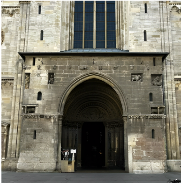
Figura 8. Portal gigante de Santo Stefano