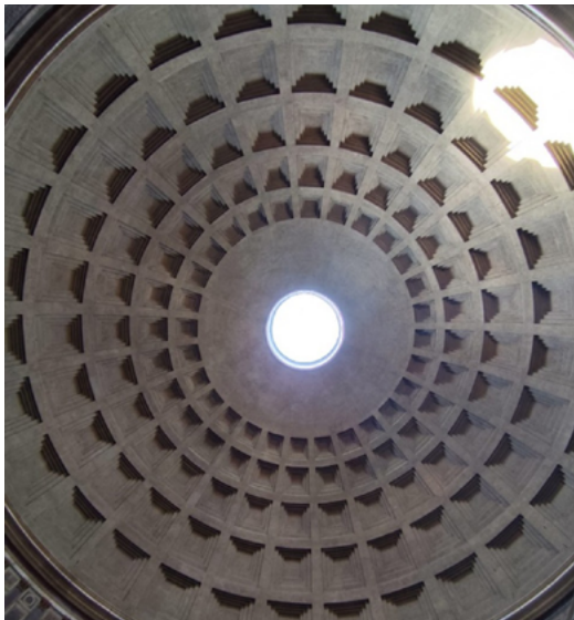
Figura 3. Cúpula do Panteão com óculo centralizado

O óculo presente na cúpula possui 9 metros de diâmetro e não possui uma função apenas estética, mas é também um elemento estrutural. Ele reduz o peso da cúpula e permite a entrada de luz natural, de modo a criar um efeito dramático no interior do monumento.