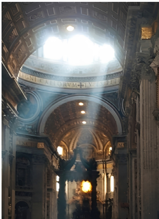
Figura 4. Detalhe para a luz natural entrando pela cúpula, o baldaquino ao centro, um dos quatros pilares estruturais à esquerda do baldaquino e a inscrição em latim na base do tambor da cúpula