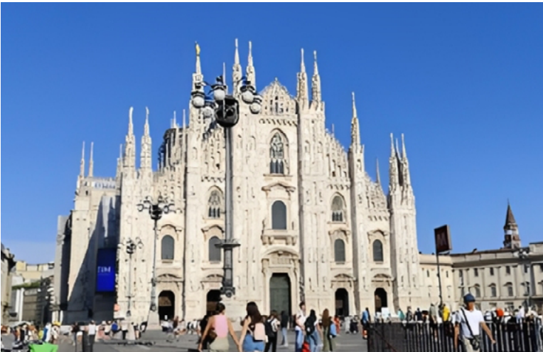
Figura 6. Domo de Milão

Finalizando o que apresentamos, que é em linhas gerais a ideia de que há em Bramante uma coerência conceitual-construtiva, que se baseia principalmente no que o próprio Bramante chamou de conformità , que é no fundo conceber a arquitetura na relação orgânica das suas partes, isto significa não só uma teoria de arquitetura, mas subjaz nesta conduta, aparentemente apenas operativa, um lastro de orientação histórica.