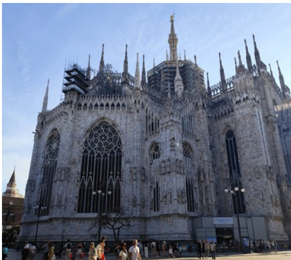
Figura 7. Tibúrio Domo de Milão