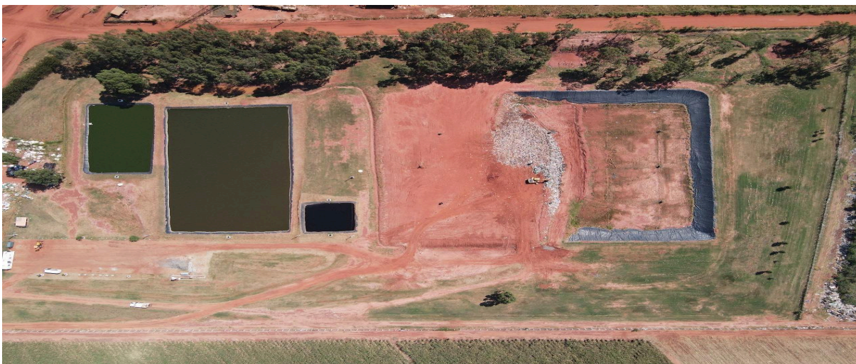
Figura 5: Lagoas anaeróbia, facultativa e maturação do Aterro Sanitário de Nova Andradina em 2020