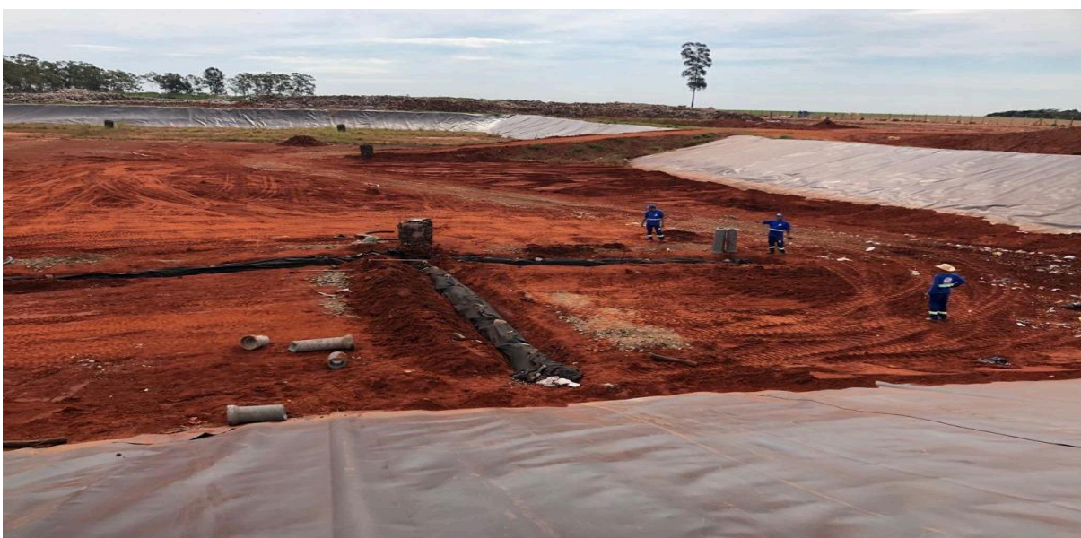
Figura 4: Instalação dos drenos horizontais e verticais.

O aterro do município de Nova Andradina possui três valas impermeabilizadas com manta de PEAD, um material durável e impermeável. Essa manta impede a infiltração do chorume no solo, que é drenado e tratado por um sistema de drenos horizontais. Drenos verticais controlam a queima de gás metano gerado pela decomposição da matéria orgânica. Esses drenos são feitos de tubos perfurados, pedras e uma manta de geotêxtil para evitar entupimentos. A Figura 4 mostra a instalação do sistema de drenos horizontais realizada no processo de construção do aterro.