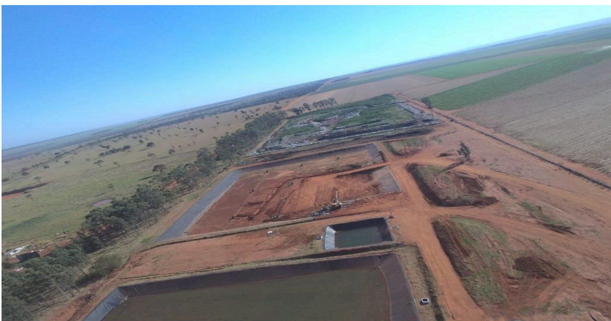
Figura 3: Início da operação do aterro sanitário de Nova Andradina em 2019.