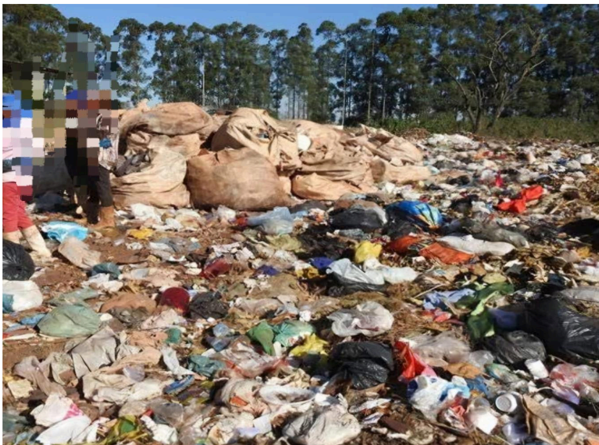
Figura 7: Lixão antes da recuperação