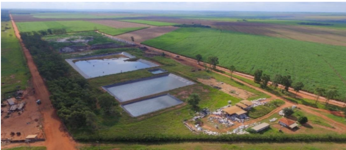
Figura 2: Vista aérea do aterro de Nova Andradina em 2019, antes de sua operação.