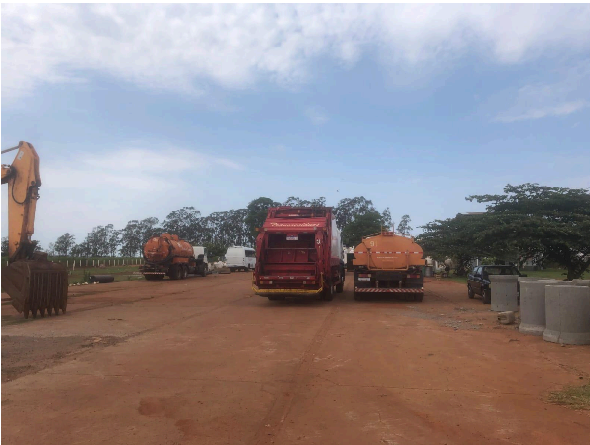
Figura 9: Veículos utilizados para a coleta e manutenção do aterro.