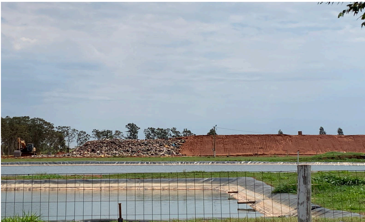
Figura 6: Primeiro remonte do aterro sanitário em Nova Andradina.