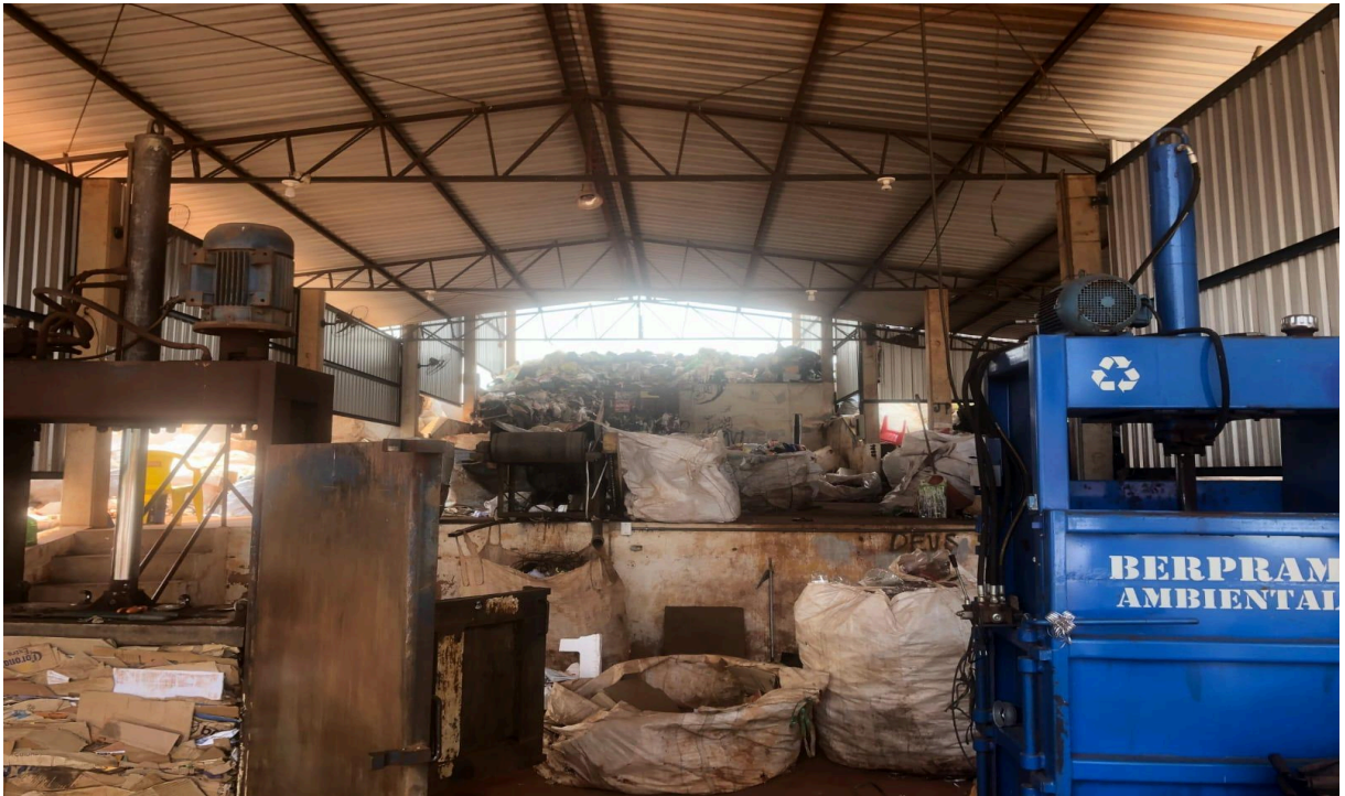
Figura 11: Materiais recicláveis que serão mantidos em circulação