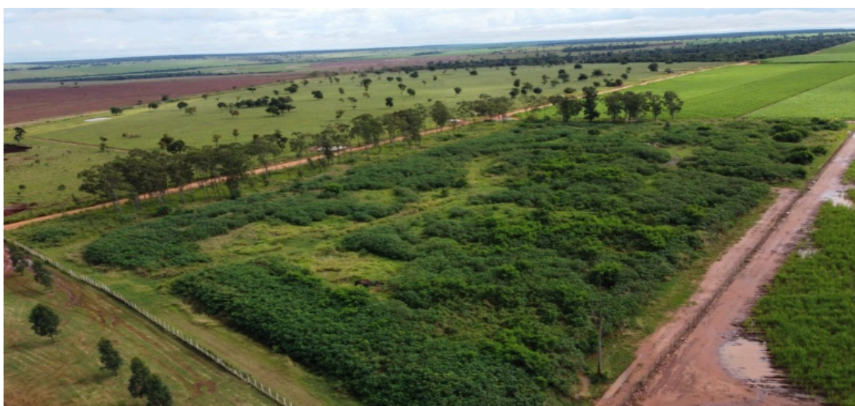
Figura 8: Lixão em sua fase final