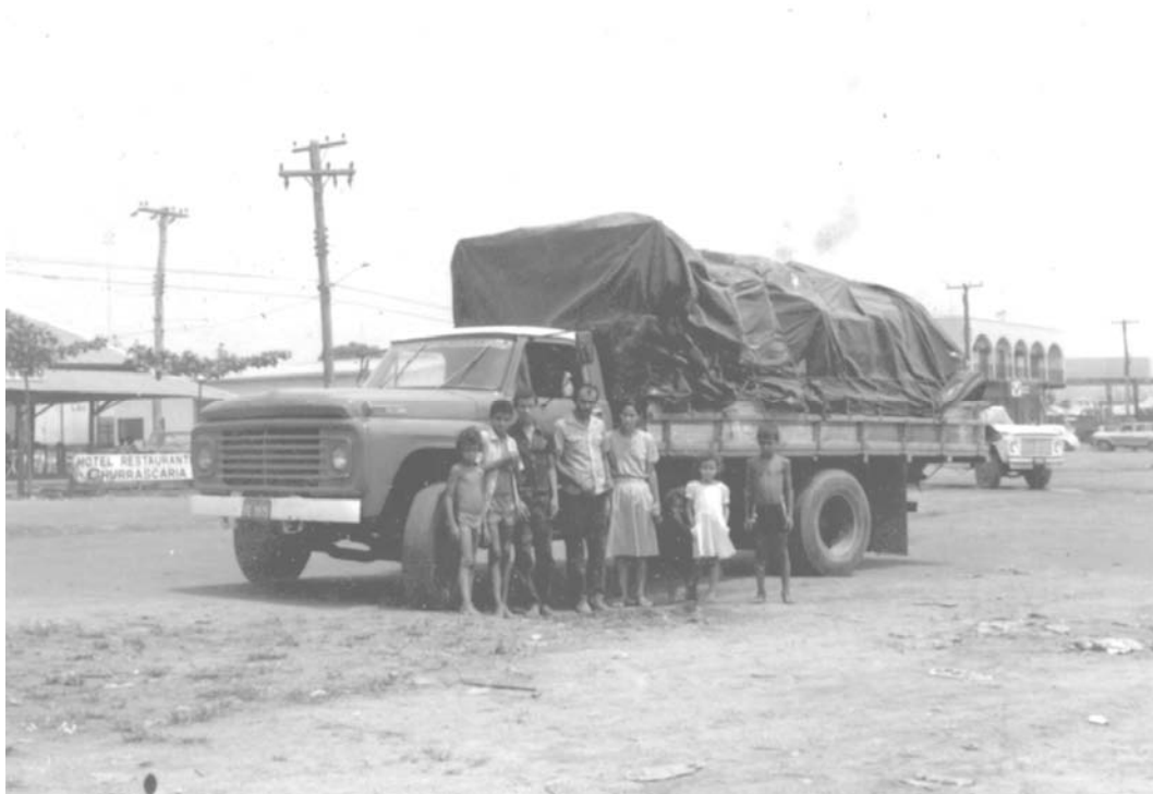
Foto 5 – Década de 1980: Depoimentos dão conta de que a chegada de mudanças era um fenômeno intenso, principalmente nos primeiros anos da década de 1980.