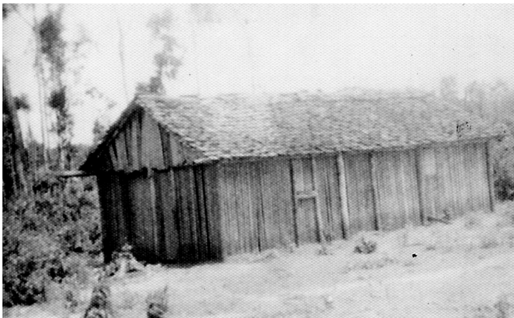
Foto 7 – 1979: Escola Pereira da Silva, coberta com tabuinha e parede de lascas de coqueiro