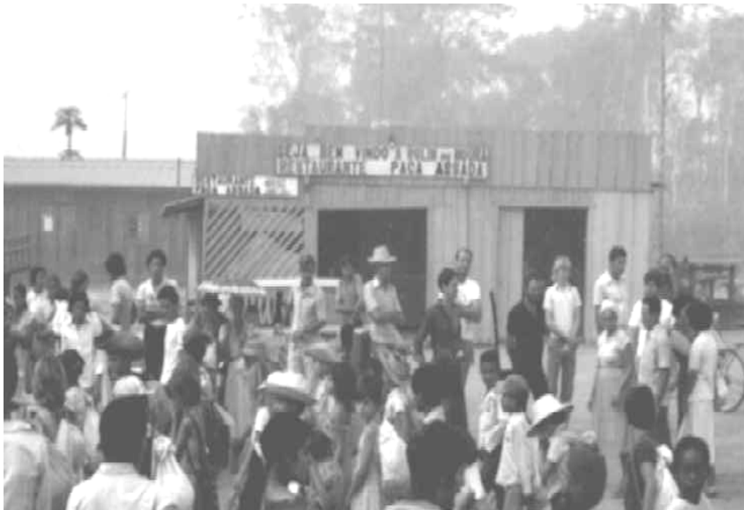
Foto 3 – 1980: “Restaurante” Paca Assada. Estabelecimento comercial, espécie de estação rodoviária