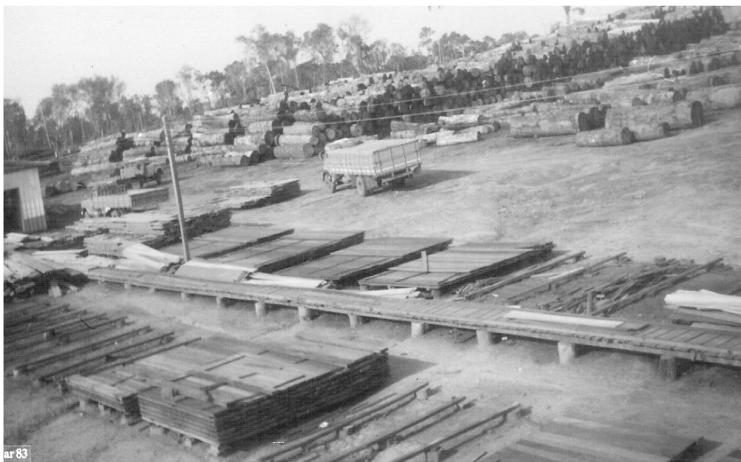
Foto 4 – 1983: Pátio de madeira em R. Moura. Depósito de mogno, em toras e já serrado, para exportação