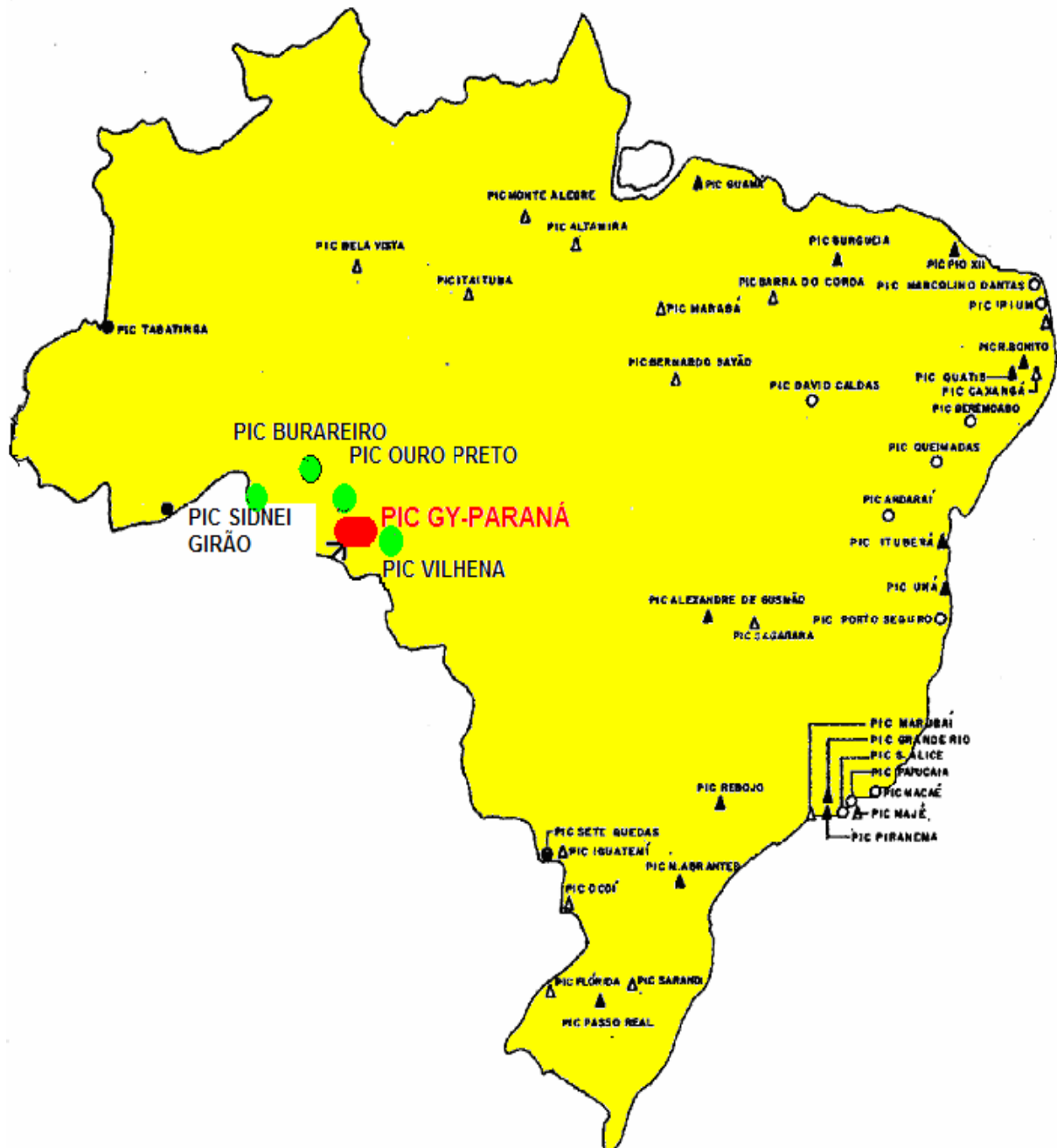
MAPA 2 - LOCALIZAÇÃO DOS PICs, DESTACANDO O PIC GY-PARANÁ (ilustrativo, sem escala)