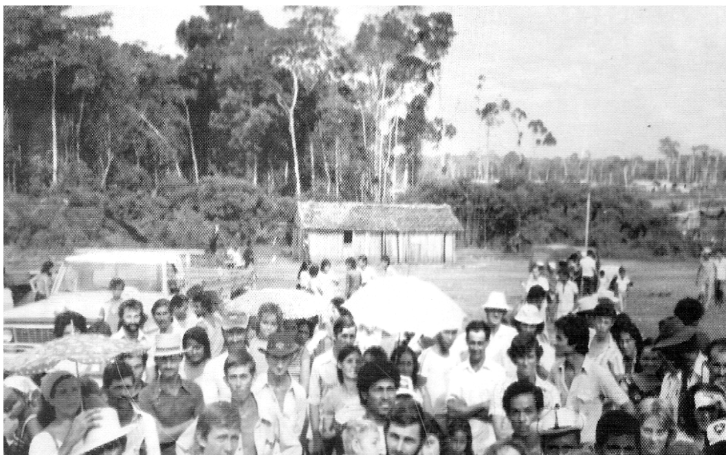
Foto 6 – 1979: Escola Pereira da Silva; aos fundos, lado superior direito, habitações onde atualmente é o centro da cidade.