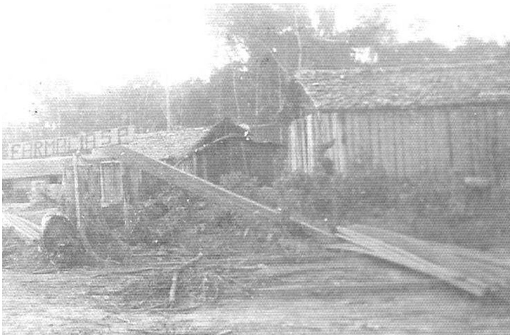
Foto 2 – 1976: Primeiras construções do centro da cidade; atual Avenida 25 de Agosto