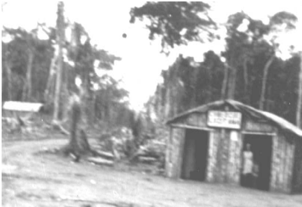
Foto 01 – 1977: Construção considerada primeiro ponto comercial da cidade, onde teriam se hospedado as primeiras professoras ao chegar à localidade; atual cruzamento das Avenidas Norte-Sul com 25 de Agosto.