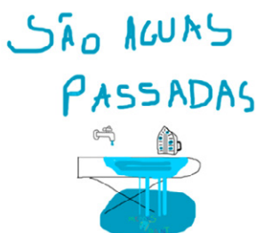
Figura 5: Exemplo de “águas passadas” 3