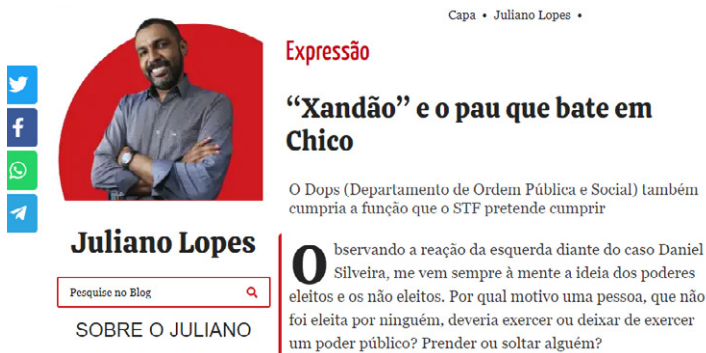
Figura 6: Exemplo de “pau que bate em Chico” 1