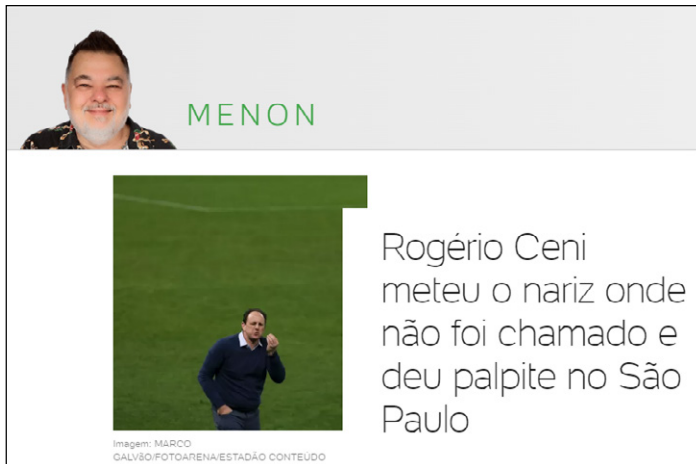
Figura 1: Exemplo de “meter o nariz onde não é chamado” 1