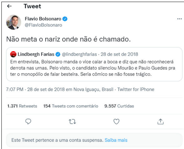
Figura 2: Exemplo de “meter o nariz onde não é chamado” 2