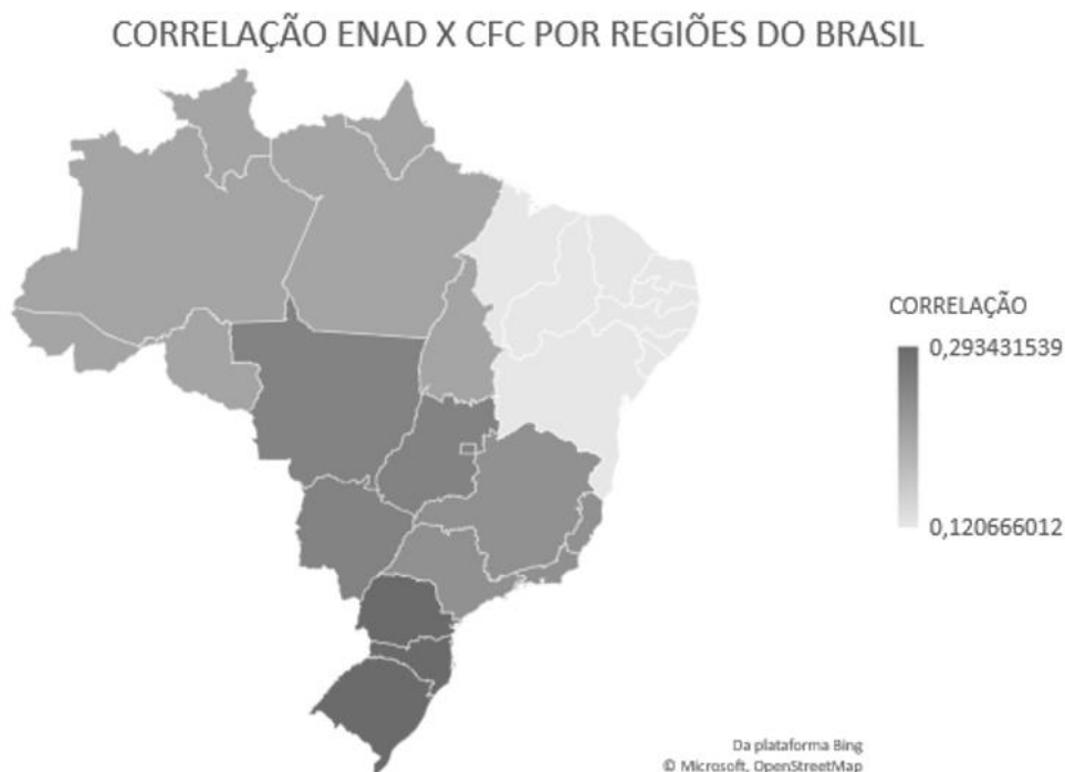
Figura 2: Correlação regional

Para melhor ilustrar esse resultado, foi elaborado o gráfico apresentado na Figura 2, destacando a correlação nas regiões. As cores escuras representam uma correlação mais forte e as cores claras representam uma correlação fraca, o que possibilita a análise específica de cada localidade, lembrando que em todos os lugares a correlação foi estatisticamente fraca.