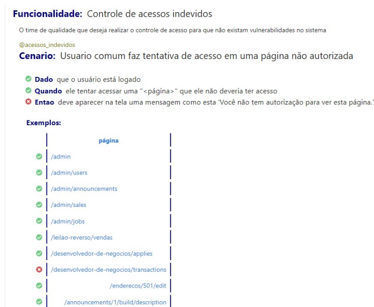
Figura 4. Relatório da Funcionalidade de Controle de Acessos