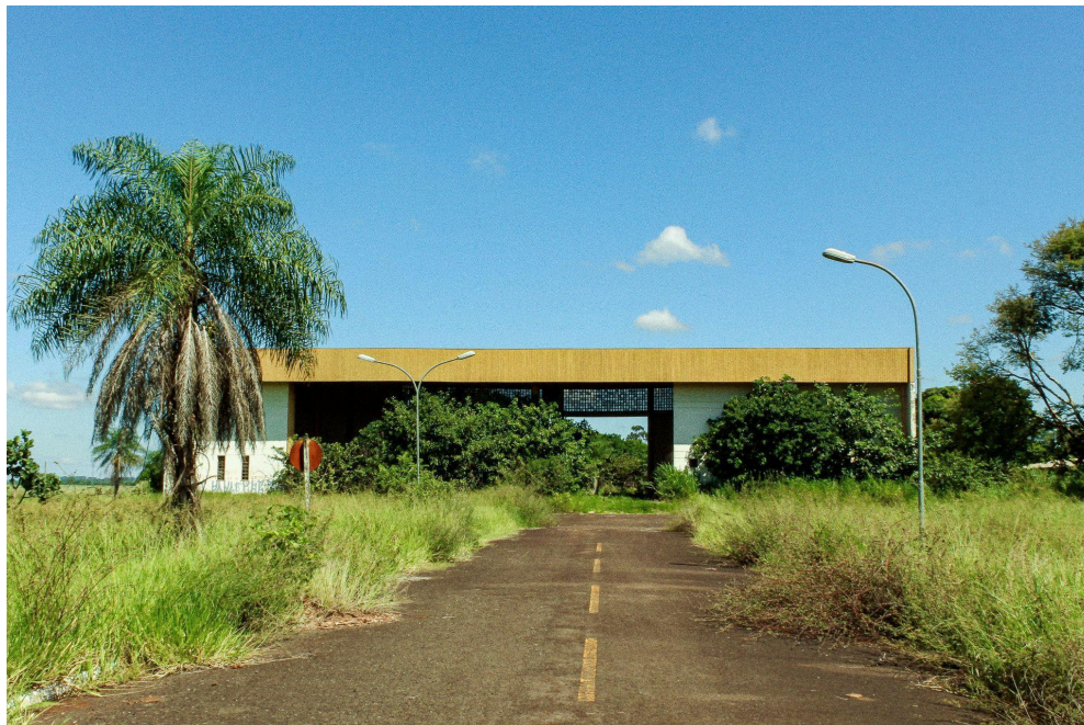
Figura 4 - Exterior da estação Trem do Pantanal no Indubrasil.