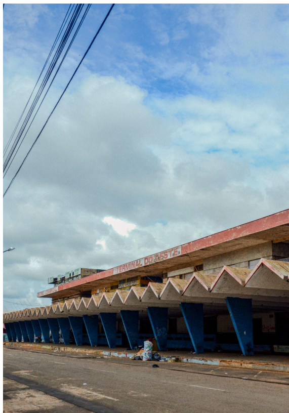
Figura 2 - Cena's Bar, uma das salas comerciais que resistiam na Antiga Rodoviária.