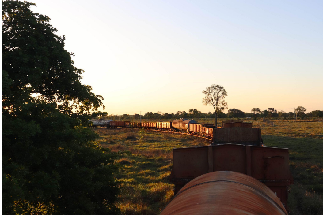
Figura 8 - Cemitério de vagões no Terminal Intermodal de Cargas.