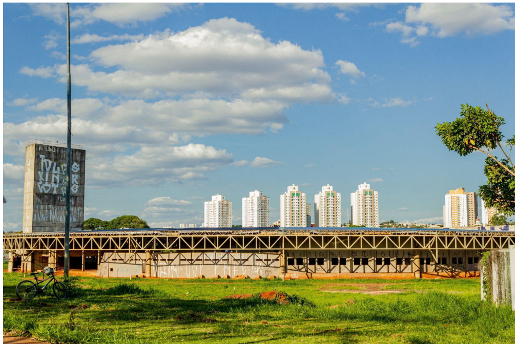
Figura 10 - Moradia de pessoas em situação de rua - às margens da Avenida Ernesto.