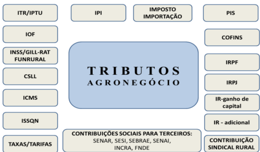
Figura 3 - Principais tributos pertinentes a atividade do agronegócio.

O agronegócio como um dos mais importantes setores da economia, abrangendo uma grande complexidade de atividades e cadeias produtivas é impactado por uma diversidade de impostos, conforme figura 3.