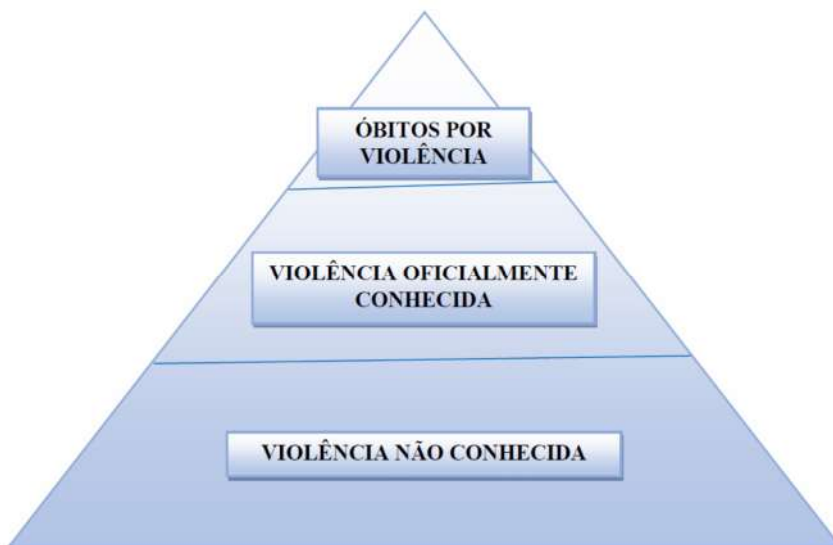
Figura 3: Pirâmide de conhecimento dos casos de violência

O SAMU é um serviço emergencial e, portanto, encontra-se no meio da pirâmide. Seus atendimentos à criança e ao adolescente em situação de violência podem apresentar dificuldades relacionadas à percepção do fenômeno, os sentimentos gerados por este e seu enfrentamento.