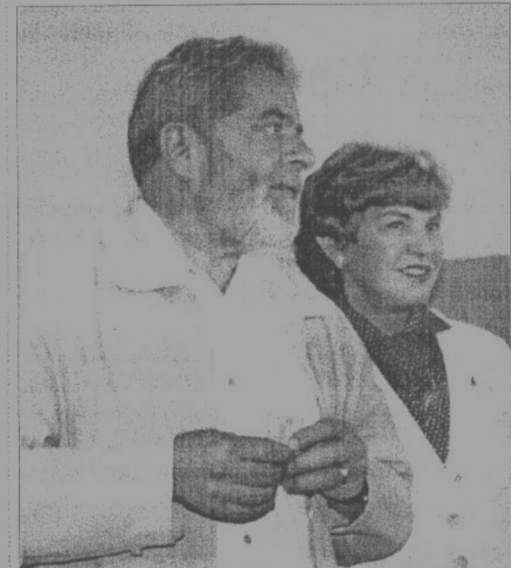
Presidente Lula e esposa Marisa