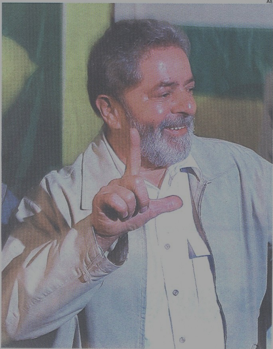
Lula votou ontem de manhã em São Bernardo do Campo, onde iniciou a carreira