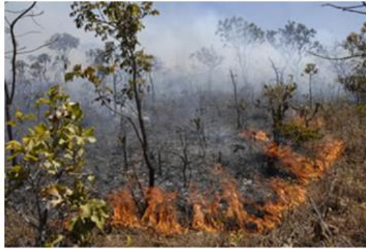
Queimadas no cerrado