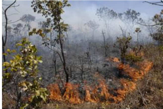
Queimadas no cerrado

O cerrado é a segunda maior formação vegetal brasileira e cobria aproximadamente 25% do território brasileiro. Atualmente, conforme dados do Ministério do Meio Ambiente, apresenta menos de 20% da antiga área, dos quais, menos de 2% estão protegidos em parques ou reservas.