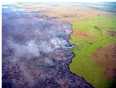
Queimada no Pantanal.